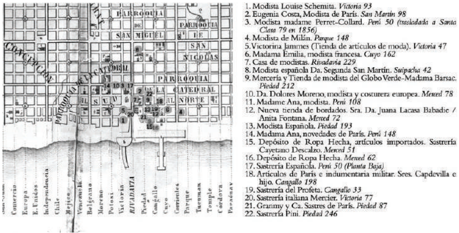
Figura 1. Tiendas de modistas y sastrerías en Buenos Aires, 1854-1861

Fuente: Elaboración propia sobre plano de la ciudad de Buenos Aires con divisiones parroquiales de 1859 del AGN, a partir de información extraída del Censo de Población de 1855 y de avisos clasificados del diario El Nacional (1854-1861).