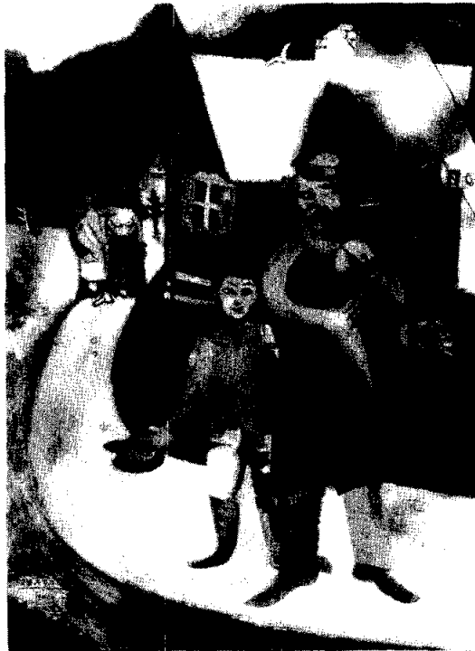
El Violinista, Marc Chagall.

¿Cómo haré sonar los acordes de la tambora indígena? La pediré prestada; para gritar en un país desierto, el alarido sin sentido; ¡Devuélvanme mi infancia! Toda ella, incluso los negruzcos atardeceres que ya no veré.