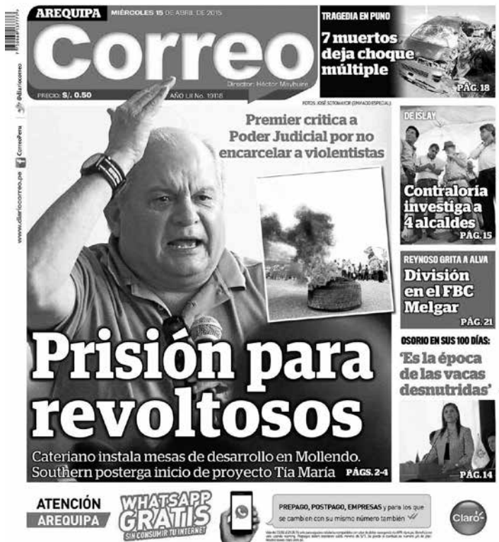
Figura 4. Titular con el Primer Ministro Pedro Cateriano invocando «prisión para los revoltosos», en diario Correo , edición Arequipa, 15 abril 2015.

la creación de un frente de defensa como una asociación ilícita para delinquir es parte de la estrategia de criminalización de las protestas y eso al parecer coincide con las reacciones de los otros poderes del Estado, sobre todo del Ejecutivo y sus representantes, cuando estuvieron en la zona como puede observarse en la primera plana del diario Correo del miércoles 15 de abril del 2015 . En esa fecha varios ministros, entre ellos el Premier Pedro Cateriano, viajaron a Arequipa con la finalidad de participar de una mesa de diálogo con los tres alcaldes de la zona que se habían plegado al paro general del valle de Tambo (eran los alcaldes de la provincia de Islay y de los distritos de Cocachacra y Dean Valdivia). Lamentablemente a su llegada el Primer Ministro Cateriano dio unas declaraciones que fueron glosadas en la portada del diario Correo bajo el título «Prisión para revoltosos» y como un cuestionamiento al propio Poder Judicial por no dictar ordenes de captura contra los dirigentes que encabezaban el paro. Posteriormente, los tres alcaldes que iban a participar de esa reunión —que finalmente abortó— fueron denunciados y tienen hasta la fecha procesos pendientes.