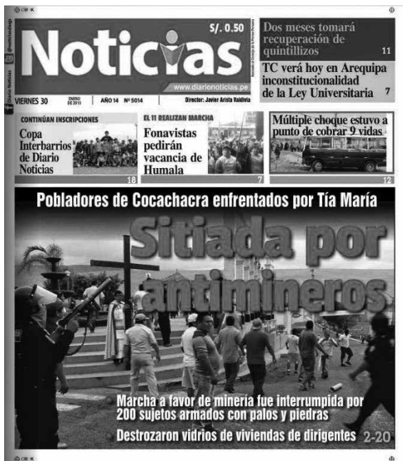
Figura 2. Poblado de Cocachacra «sitiada por antimineros». Instalación de la imagen de «antimineros» violentos. Titular del periódico Noticias, Arequipa, 30 enero 2015.

fiscalía. Desde julio de 2011 hasta mayo de 2016 (gobierno de Ollanta Humala) han sido asesinadas 65 personas en conflictos sociales, 57 de ellas debido al uso excesivo de la fuerza de la PNP o el Ejército o fuerzas combinadas 10 .