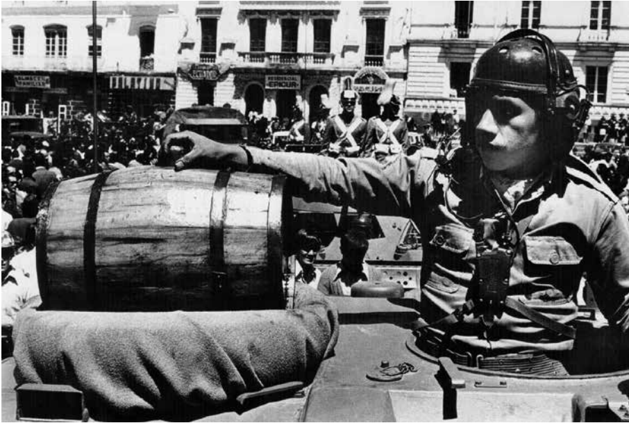
Celebración y festejo extractivista: desfile militar con el primer barril de petróleo en las avenidas de Quito (1972).

Ese tipo de liturgias están presentes en la actualidad. Otro caso impactante tuvo como protagonistas al presidente de Bolivia, Evo Morales, ministros y autoridades, en los festejos de un nuevo yacimiento petrolero que permitiría triplicar las reservas de crudo del país (junio de 2015 5 ). En un momento de la celebración, Morales en un estrado ubicado en ese campo petrolero, y de frente a los asistentes, sonriente,