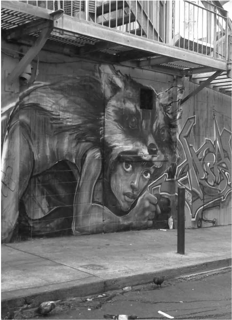
SAN FRANCISCO