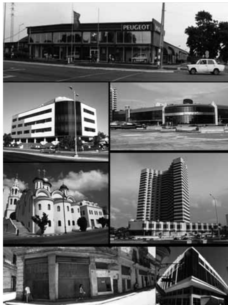
Figura 1. Desterritorialización de la arquitectura y la ciudad en La Habana.