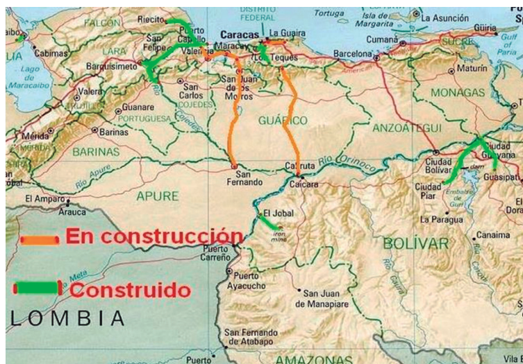
Figura 2 Mapa de vías férreas venezolanas construidas y en construcción

El sector telecomunicaciones obtuvo un incremento en 2008 entre 16 y 18% con aumentos en inversión entre 15% y 17%, con respecto al año 2007. Durante el primer trimestre del 2009, los ingresos generados por la actividad Comunicaciones representaron un aporte al PIB consolidado de 5,8%,