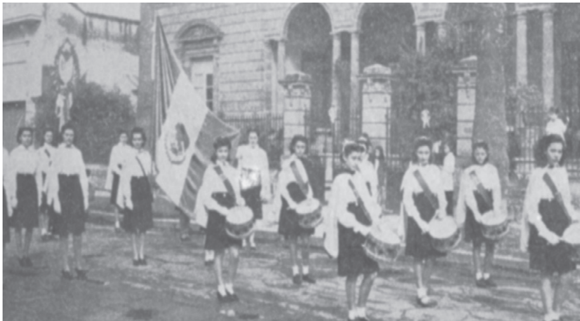
Anuario del Colegio Aquiles Serdán 1942-1943.