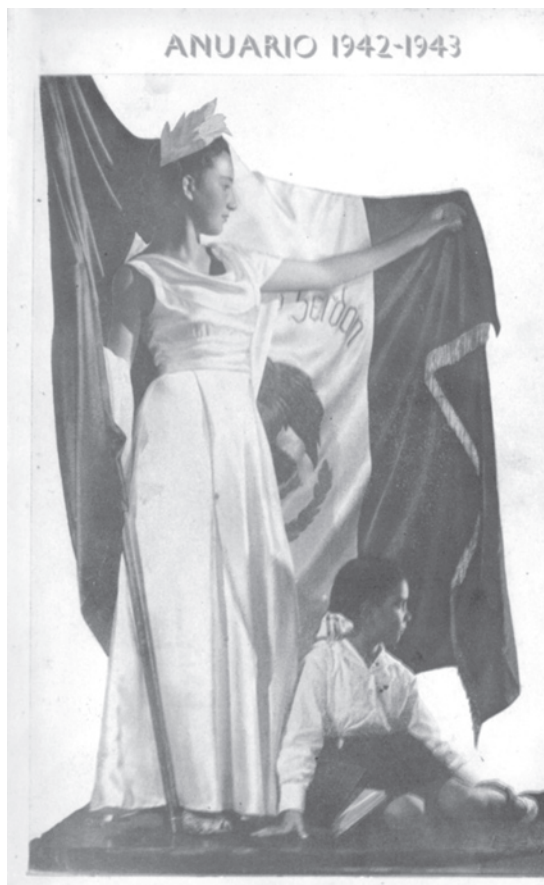
Portada del Anuario del Colegio Aquiles serdán.

Debido a los violentos ataques, a varios asesinatos de maestros rurales y a diversos conflictos urbanos, el Estado revolucionario disminuyó su abierta confrontación con la Iglesia. La disminución de estas tensiones permitió a este grupo de católicas usar en 1937 sus redes sociales y su experiencia en la enseñanza para crear una escuela