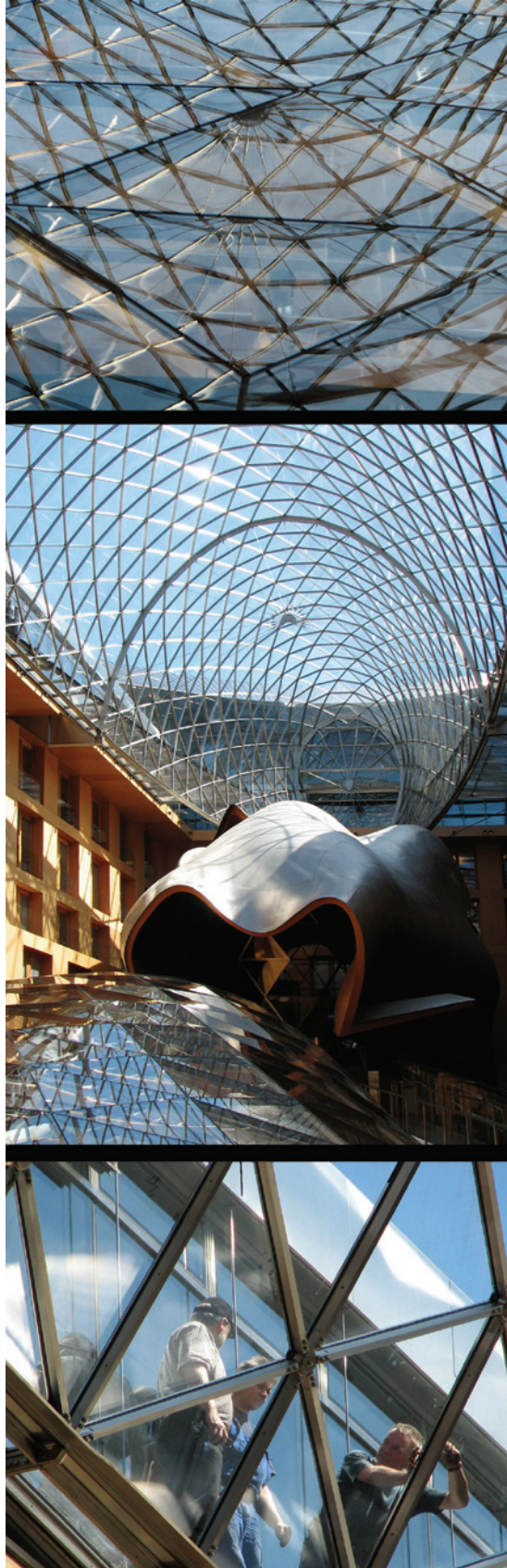
Fragmento de la serie Este - Oeste Berlín

la mecánica cuántica y, sin embargo, es imposible deducirla de un principio simple. Más bien se trata de deducir cómo debe ser una ecuación para que sea consistente con algunos hechos empíricos, y ver si funciona. ¡El mayor misterio de la mecánica cuántica es que funciona estupendamente!