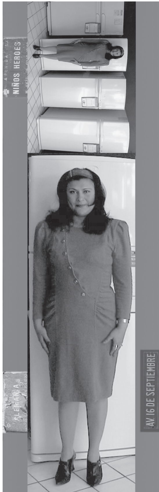
Fragmento de la serie Este – Oeste Guadalajara

¿Puede ya responder la exigencia planteada en cada inciso?