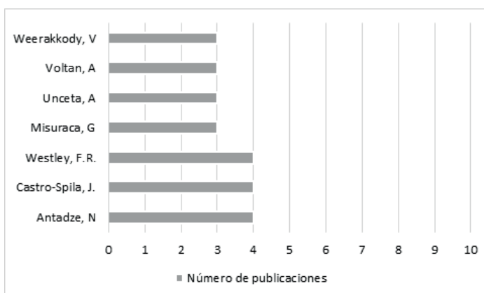
Gráfico 3 Principales autores por cantidad de publicaciones

Además, pueden distinguirse autores cuya producción particular aborda el tema de la innovación social en forma permanente (Gráfico 3).