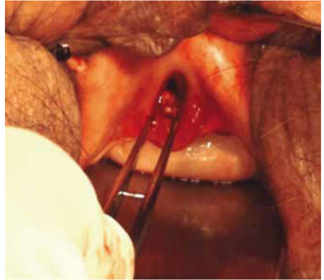
Figura 3 Lecho quirúrgico posresección del hemangioma.