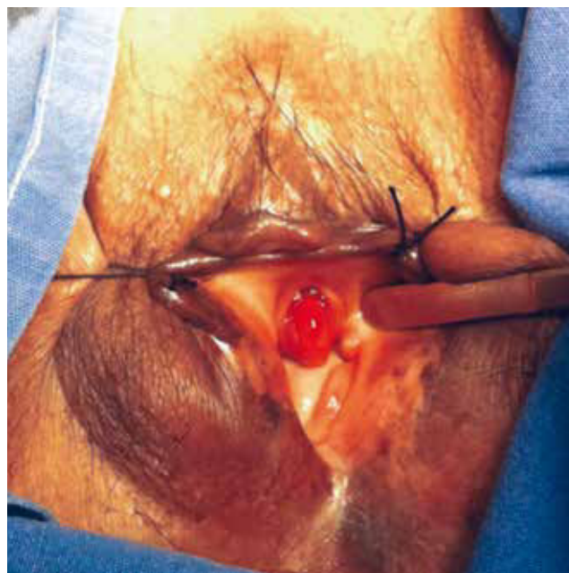
Figura 1 Hemangioma uretral con involucro del meato y tercio anterior de la uretra.

Se realiza resección de dicha tumoración (figs. 2 y 3). El estudio histopatológico reporta un hemangioma uretral con grandes vasos venosos dilatados entre un estroma laxo, así como ureteritis quística con nidos de Von Brunn. La inmunohistoquímica con CD34 y actina alfa para endotelio y músculo liso, demostró el perfil irregular de la proliferación vascular, y las células musculares lisas no marcaron a CD34, no expresando receptores hormonales de estrógenos y testosterona (figs. 4 y 5). Al mes del procedimiento quirúrgico presenta nuevamente uretrorragia severa, se decide practicar una segunda cirugía, con una resección más amplia, abarcando el tercio medio de la uretra, nueva fulguración del lecho y como derivación urinaria una cistostomía