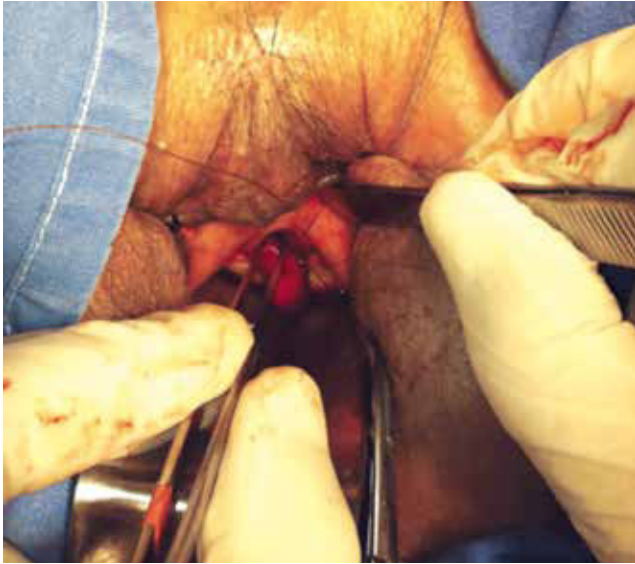
Figura 2 Resección de la tumoración y labio posterior del segmento anterior de la uretra.