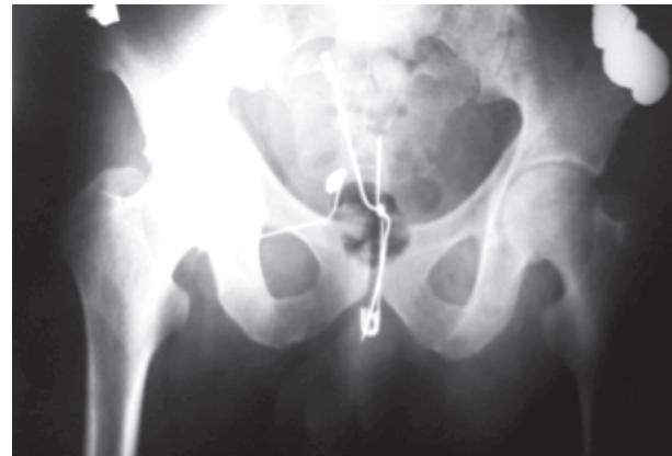
Imagen 1. Rx AP de pelvis que muestra tres objetos metálicos punzo-cortantes en topografía vesical y uretral.

Manejo. Se da profilaxis con toxoide tetánico y gammaglobulina antitetánica. Se transfunde tres paquetes globulares, se inicia antiespasmódico, analgésico, antibiótico y se decide extracción de los cuerpos extraños por endoscopia. Se introdujo el cistoscopio, visualizando uretra peneana permeable, sin laceraciones en mucosa. En la uretra bulbar se encontraron dos cuerpos extraños metálicos punzocortantes. Se extrajo sólo uno de los dos objetos con pinzas de cuerpo extraño, debido a que el otro objeto presentaba su punta y se quiso evitar la laceración de la mucosa uretral al retirarlo. Se decidió realizar cistostomía, para la extracción de los objetos restantes. Se evidenciaron dos cuerpos extraños punzocortantes oxidados en vejiga, uno de los cuales se encontraba perforando la pared vesical