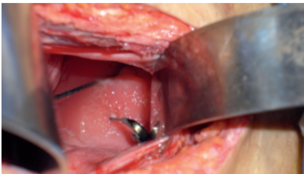
Imagen 2. Cuerpo extraño que protruye a través del cuello vesical, con edema bulloso circundante. Presencia de un segundo cuerpo extraño en la luz vesical.