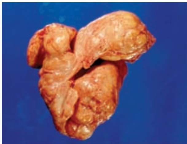
Imagen 1. Pieza quirúrgica; vista anterior.