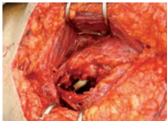
Imagen 2. Fotografía de imagen macroscópica de la vejiga obtenida durante la operación en la que se muestra engrosamiento de todas las capas de la pared vesical por cistitis grave con reacción inflamatoria perivesical también de gravedad.