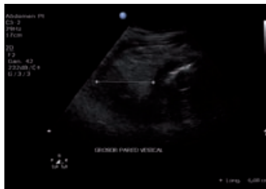
Imagen 1. Ultrasonido de vejiga en el que se advierte un engrosamiento de todas las capas de la vejiga y el tejido perivesical, así como la presencia de gas por debajo de la mucosa vesical.

El paciente siempre se mantuvo afebril y en buen estado general. Los cultivos de orina y los cultivos para aerobios y anaerobios obtenidos en la sala de operaciones del tejido inflamatorio se reportaron como negativos y nunca se aisló una bacteria causal. La creatinina descendió a 0.75 mg/dl y el leucograma descendió a 9 550. Las biopsias de vejiga reportaron cistitis aguda grave enfisematosa ( Imagen 3 ). No hubo infección de la herida quirúrgica y una semana después se observó mejoría con disminución de la masa en hipogastrio y desaparición del edema de genitales y miembros inferiores. En esas condiciones se transfirió al paciente por vía aérea a Portugal, de donde se reportó mejoría progresiva en los días subsiguientes.