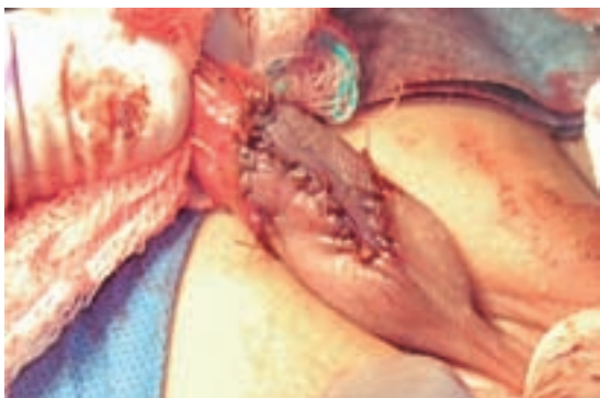
Imagen 4. Región ventral de pene cubierta por los colgados de Byar.

En 1973, Devine y Horton clasificaron la cuerda sin hipospadias en grupos basados en las diferentes causas involucradas. El tipo I se considera el defecto más serio. Resulta de la deficiencia del cuerpo esponjoso, el dartos y la fascia de Buck en la porción de uretra comprometida. Por tanto, la uretra se localiza justo debajo de la piel y el tejido fibroso que subyace a la uretra es el determinante de la cuerda. En el tipo II el cuerpo esponjoso es normal, mientras que dartos y fascia de Buck son disgenéticos. En el tipo III de la cuerda sólo el dartos es deficiente, además de causante de la curvatura peniana. 5