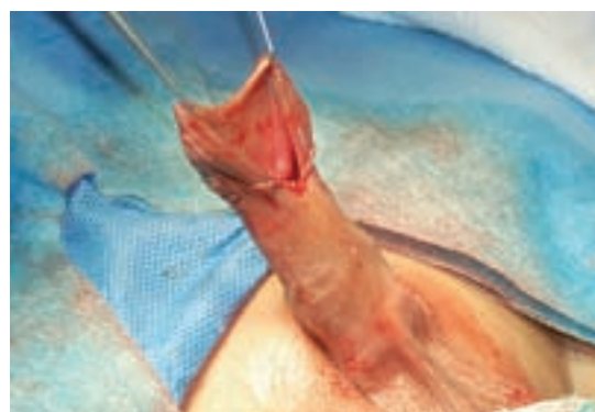
Imagen 2. Incisión en forma de "raqueta de tenis" a 5 mm por detrás de la corona dorsal del pene.