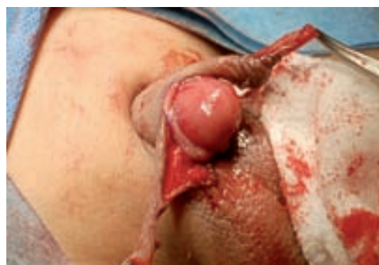
Imagen 3. Elaboración de colgajos tipo Byar, los cuales se colocan en la región ventral de pene