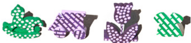
Figura 5. Opciones de la prueba de extensión orden 1 (izquierda) y orden 2 (derecha).

poseía la propiedad-meta (flor a lunares o vestido a cuadros) y el distractor (Figura 5).