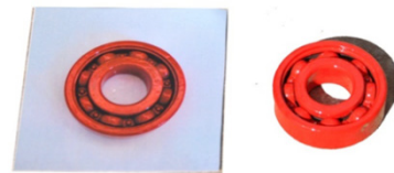
Figura 2. Opciones presentadas en la fase de prueba.

3. Fase de prueba. La tarea consistía en mostrar de manera simultánea la imagen del objeto-meta y el objeto-meta real, pidiendo al niño o niña que eligiera uno de ellos: ¿Dónde hay un pompe ? (Figura 2). Esta tarea buscaba indagar si el objeto real era igual o más aceptable como referente de una palabra nueva que su imagen.