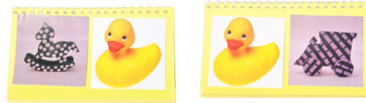
Figura 4. Libro utilizado en el estudio 2. Izquierda: objeto con la propiedad meta (Orden 1) y pato amarillo. Derecha: pato amarillo y objeto con la propiedad meta (Orden 2).

Materiales. Construimos un libro con ocho fotografías de objetos familiares: seis con propiedades convencionales -pato amarillo, oso peludo, cielo nublado, arcoíris colorido, pelota redonda y papel arrugado- , y dos con no convencionales -caballo a lunares: propiedad meta/ tren a cuadros: distractor- . El libro fue contruido de la misma manera que el del Estudio 1. La Figura 4 ilustra dos páginas de este libro. También utilizamos dos objetos reales -caballo a lunares, tren rallado- . Una propiedad -lunares- funcionó como propiedad-meta para la mitad de los participantes (Orden 1). La otra propiedad -cuadros- funcionó como propiedad-meta para la otra mitad de los participantes (Orden 2).