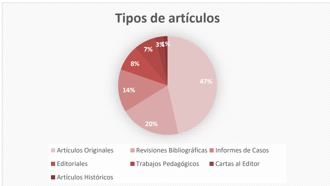
Fig. 1. Publicaciones en RIC durante 2020 según tipo de artículo.

Fueron publicados un total de 71 artículos; figurando 12 artículos en cada uno de los números regulares, con excepción del Número 4 que tuvo 11. De dicho total: 6, fueron Editoriales; 2, Cartas al editor; 33 se encontraron como Artículos originales; 5, Trabajos pedagógicos; 10 enviados como Informes de casos; 14 fueron Revisiones bibliográficas y 1 correspondió a la sección de Artículos históricos (Figura 1). Los artículos originales, incluidos los de corte pedagógico como refieren las Políticas de sección, constituyeron el 53,5 % del total.