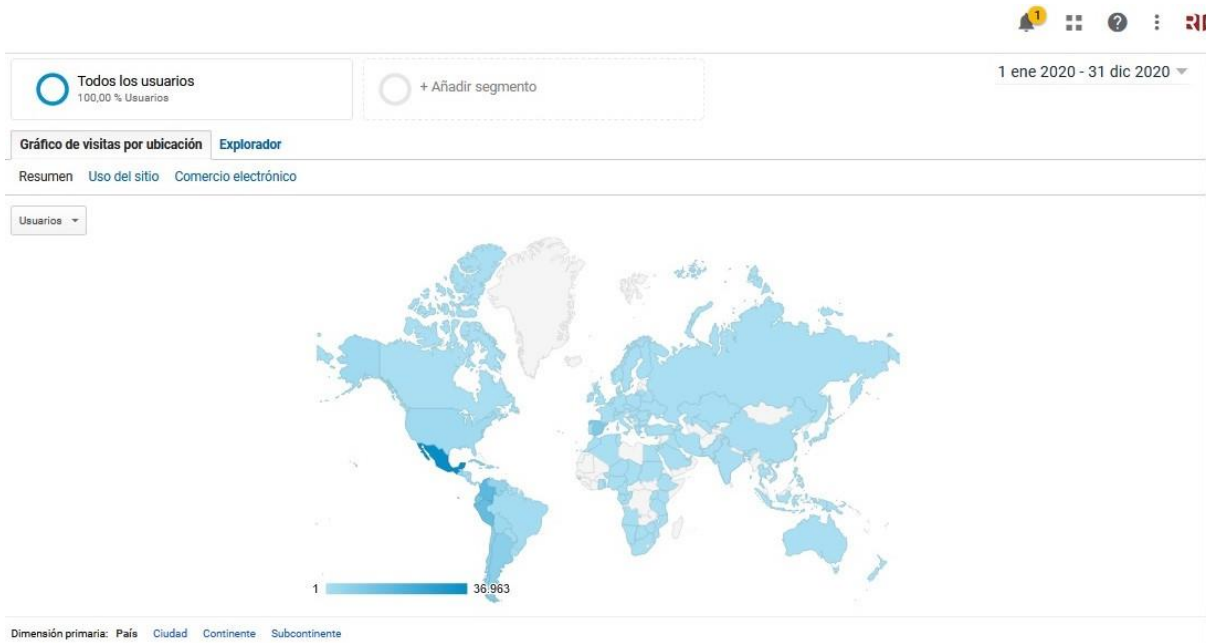
Fig. 3. Localización geográfica de las visitas realizadas a RIC durante el año 2020 (Tomado de Google Analytics , 4 de enero de 2021).

Hasta la fecha se cuentan 347 citas recibidas durante el año, con un índice h=12 , según datos de Google Scholar del día 4 de enero de 2021.