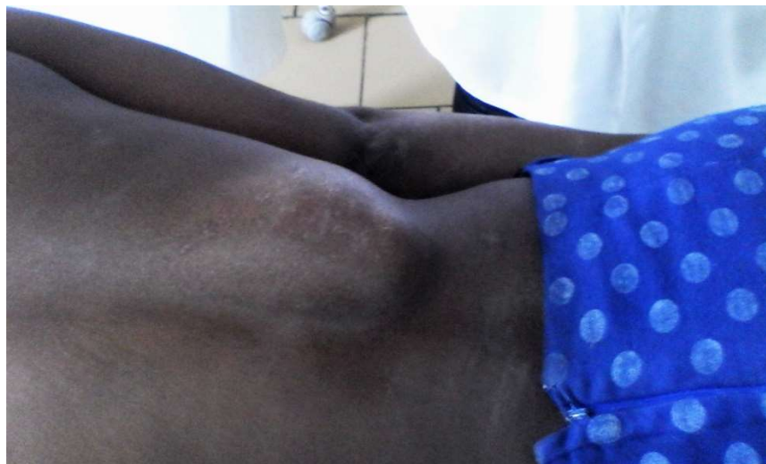
Fig. 2. Caso 2: Adulto. Localización paravertebral lumbar derecha del absceso frío tuberculoso de aproximadamente 10 cm de tamaño.