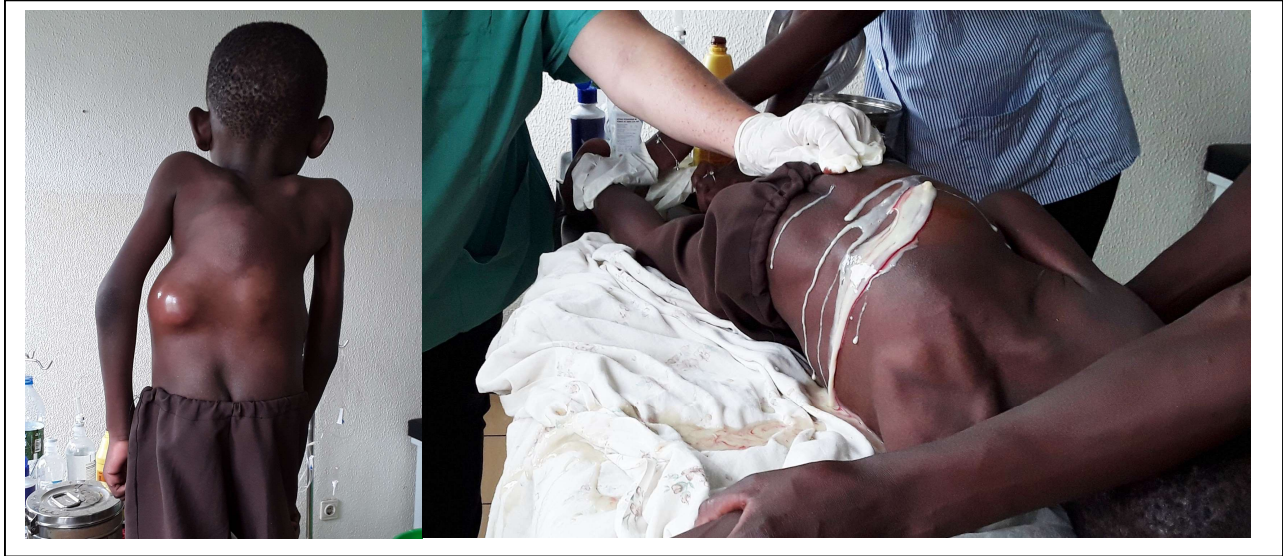
Fig. 5. Caso 5: Niño. Localización paravertebral lumbar izquierda del absceso frío tuberculoso y su contenido caseopurulento.

El examen físico objetivó desnutrición en todos los pacientes. Las tumoraciones eran de tamaño variable, visibles y palpables, bien definidas, sin signos flogísticos, de consistencia renitente, no pulsátiles y con piel que la recubría. Nótese en los infantes (Figura 2), que el paciente 4 tenía la huella de haberse drenado un absceso frío torácico posterior derecho hacía ya 15 días, y ahora presentaba nueva tumoración en región lumbar del mismo lado; por otra parte, el paciente 5 tenía una deformidad torácica posterior en joroba como secuela del mal de Pott.