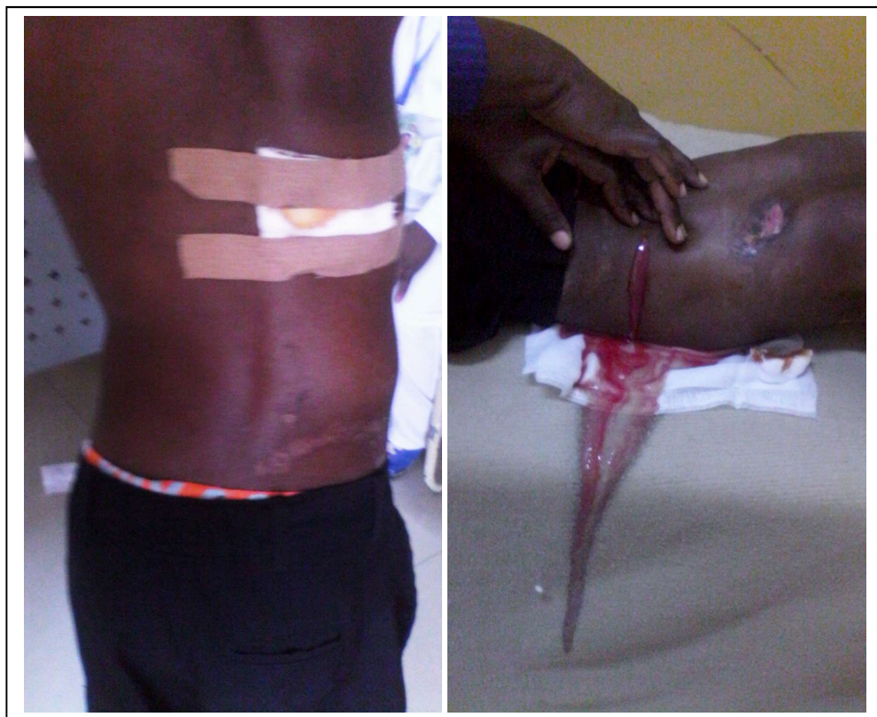
Fig. 4. Caso 4: Niño. Localización paravertebral lumbar derecha del absceso frío tuberculoso y su contenido caseopurulento.