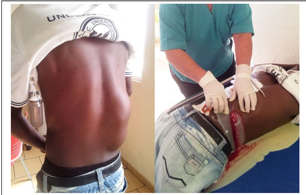
Fig. 1. Caso 1: Adulto. Localización paravertebral toracolumbar derecha del absceso frío tuberculoso y su contenido caseopurulento.

En la consulta de cirugía del Hospital General N'gola Kimbanda de la provincia Namibe, Angola se asistieron cinco pacientes (Figuras 1, 2,3,4 y 5), enviados por médicos generales de las diferentes áreas de salud con el diagnóstico de lipoma. Se interrogaron y refirieron antecedentes de TBP (casos antiguos o actuales, primoinfectados o reinfectados bajo tratamiento).