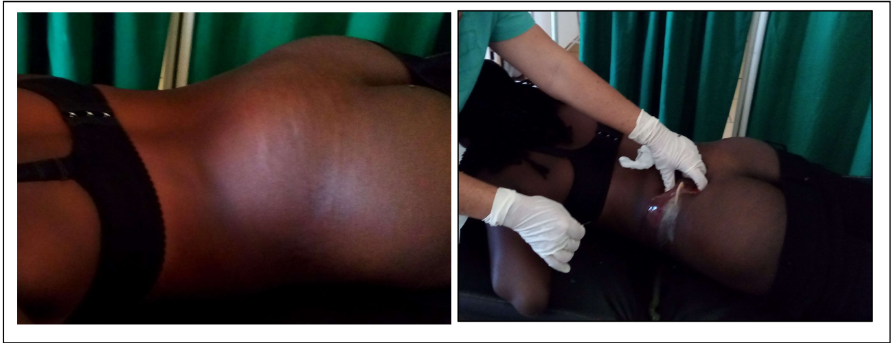
Fig. 3. Caso 3: Adulto. Localización lumbosacra izquierda del absceso frío tuberculoso y su contenido caseopurulento.