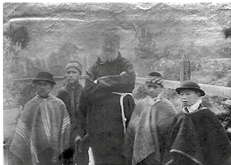
Figura 2. “Niños civilizados y niños incivilizados”, convento de Santa Magdalena de Altötting, provincia de Baviera (Alemania) Reverso de la fotografía 31

la instalación de instituciones estatales donde la escuela fue particularmente gravitante en la configuración de una nueva realidad sociocultural 29 . En esas escuelas e internados que comenzaron a surgir y distribuirse por el Wajmapu , se desarrolló un intenso proceso formativo de moralización y enseñanza práctica, se formarían sujetos disciplinados y productivos para que fueran útiles a las demandas de la sociedad chilena 30 .