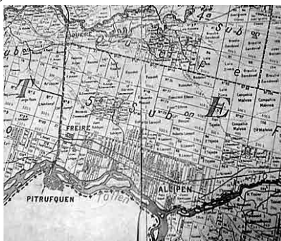
Figura 1. “Carta general de colonización de la Provincia de Cautín” 8