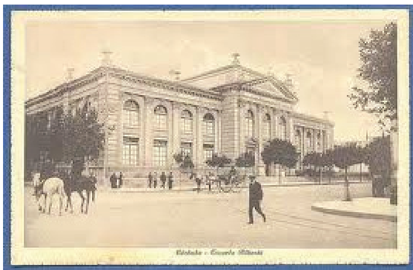
Foto 2. Escuela Alberdi

Pero su labor sufrió otro traspie al ser separada de sus cargos, lo que la decide trasladarse a la Capital Federal. Tiempo después recordó esa instancia de la siguiente manera: “La lucha ha sido ardua, el camino difícil. A cada paso un obstáculo que debía sortear sin dejar aquel sagrado deber de fe, de esperanzas, de consagración, de dignidad para poder llevar con honor el nombre de riojana” 16 .