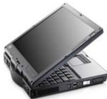
Gráfica 1. Tablet PC HP 4400.

Además, este dispositivo móvil cuenta con un software llamado Windows® Journal que permite el uso de una agenda para toma de notas, hacer manuscritos y dibujos. Cuenta también con herramientas que le permiten convertir notas manuscritas en texto, importar archivos de gráficos y compartir notas con otras personas.