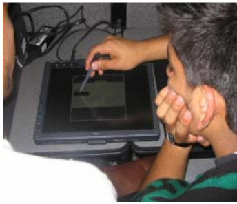
Gráfica 2. Exploración del Tablet PC HP 4400.