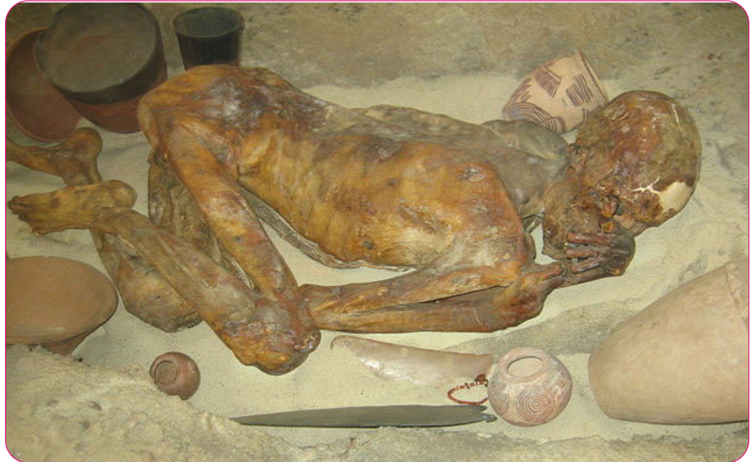
Figura 1. Momia masculina de Gebelein, que tenía tatuajes en su cuerpo (Jack1956, 2008). Atribución-CompartirIguual 3.0 No portada (CC BY-SA 3.0).

de los años, en diversas épocas y culturas, y cada una de éstas le ha dado