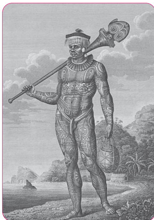
Figura 3. Tatuajes en un guerrero Nuku Hiva de las islas polinesias (Tilenius von Tilenau, 1813).

No obstante, la palabra tatuaje en realidad proviene del samoano tatú , que significa marcar o golpear dos veces; haciendo referencia al método tradicional de aplicación de los diseños (Lafuente, 2013). A partir del año 306 de la era común (e. c.) esta práctica pierde totalmente ese significado debido a que Constantino I, emperador romano, comenzó a utilizar los tatuajes como distintivo de los criminales y, en el siglo xv, en Edad Media se los relacionaría con lo diabólico. En el período de la segunda guerra mundial, se empleó el tatuaje