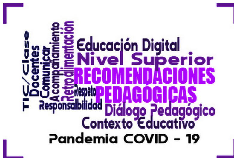
Imagen 1. Conceptos clave en para las recomendaciones pedagógicas. Elaboración propia (2021).

La educación a distancia digital en tiempos de COVID-19 ha originado problemas en el proceso educativo y ha transformado la enseñanza. A causa de la pandemia, se cerraron los centros escolares y se ha implementado la educación a distancia digital (Sánchez Mendiola et al. , 2020), un acontecimiento histórico-social que ha impactado de manera inesperada en profesores y estudiantes, pues ha afectado de manera inmediata el proceso educativo, al generar una situación desconocida que ha dado pauta a la improvisación (Barrón, 2020). Dichos cambios en el trabajo docente deberán ser aprovechados como una oportunidad para reflexionar y diseñar estrategias didácticas que promuevan en el estudiante la motivación y el compromiso para continuar estudiando a distancia. Por ello, se proponen los siguientes conceptos clave para el desarrollo de recomendaciones pedagógicas (ver imagen 1).