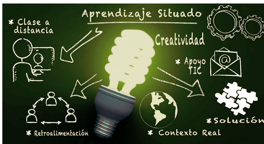
Imagen 2. El aprendizaje situado es una recomendación pedagógica. Elaboración propia (2021).

Las actividades y tareas desde los principios pedagógicos de la enseñanza situada se caracterizan por la creatividad e innovación, ya sea mediante proyectos planeados o improvisados, que se relacionan con las competencias educativas y las necesidades detectadas en los estudiantes desde un contexto escolar y de la vida diaria (Díaz Barriga Arceo, 2006). Dichas actividades tienen una variedad de posibilidades para ser realizadas. La solución no es lineal ni estructurada, existen diferentes caminos para su solución, representada en un producto final de aplicación real, útil y significativo en la vida diaria (ver imagen 2).