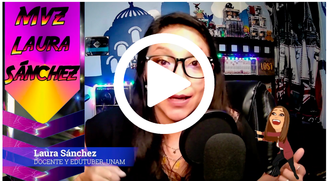
Entrevista (parte 2). Reflexiones acerca del futuro de la educación digital.