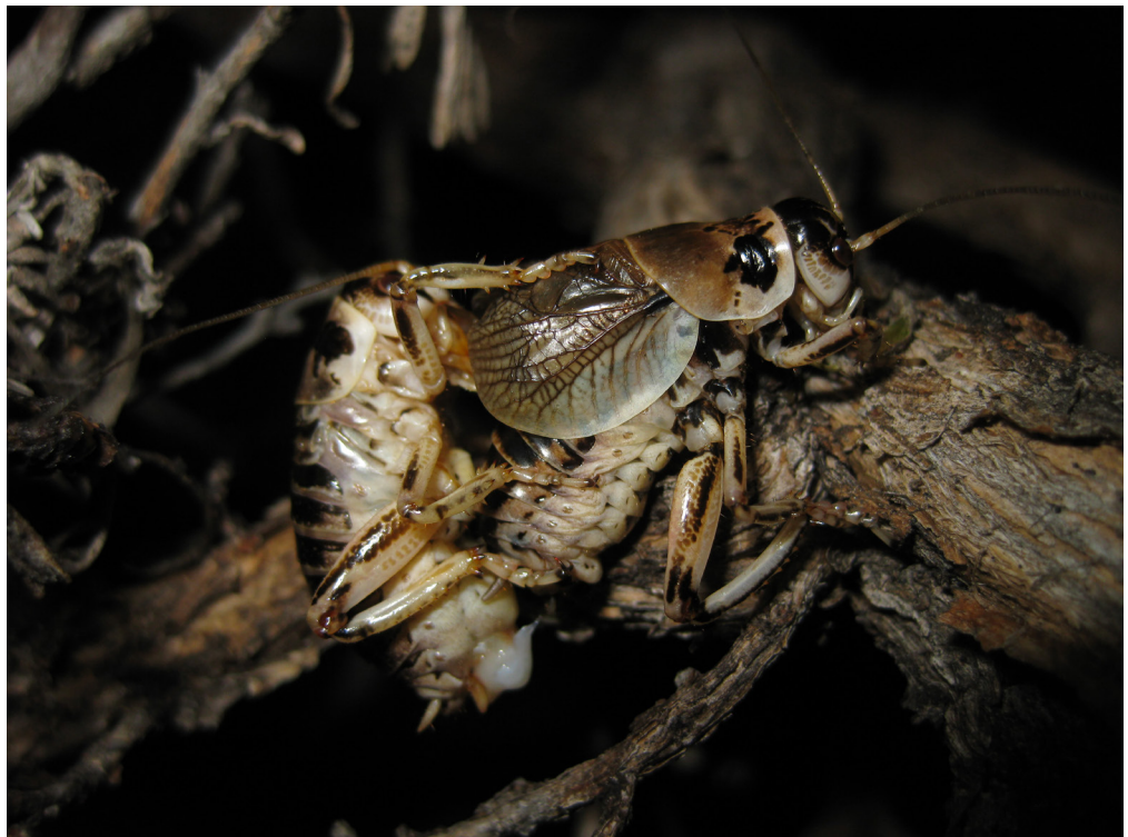
Imagen 3. Cyphoderris strepitans al momento de succionar la hemolinfa del macho durante la cópula (Judge, 2009).

Quizá el evento de reproducción suicida más conocido es el presente en la reproducción de algunas especies de mantis. Tomaremos por ejemplo a Stagmomantis limbata , esta especie de mántido presenta un comportamiento nupcial peculiar por parte de los machos. Si este detecta la posibilidad de aparearse con más de una hembra disminuye al mínimo la posibilidad de ser canibalizado. Sin embargo, en condiciones controladas, se ha observado un comportamiento suicida cuando no existe posibilidad de volver a aparearse (Maxwell, 1998). Posiblemente, la evolución llevó a que los machos de esta especie desarrollen dos tipos de comportamientos durante el cortejo y la reproducción: la primera, la autopreservación para asegurarse de dejar un mayor número de descendencia, y la segunda, el suicidio, que constituye un regalo nupcial, para asegurar el desarrollo de crías fuertes al darle su cuerpo a la hembra como comida justo cuando comienza la formación de sus huevos.