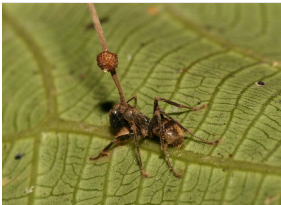
Imagen 2. Hormiga Camponotus leonardi parasitada por el hongo Ophiocordyceps unilateralis (Pontoppidan, Himaman, Hywel-Jones, Boomsma y Hughes, 2009).

Todo comienza con la entrada al organismo hospedero de las esporas 10 del hongo a través de su sistema respiratorio. Una vez dentro, el parásito crece, se alimenta de los tejidos no vitales y deja el sistema nervioso intacto. Una vez alcanzada su madurez, el hongo libera ciertos químicos que provocan cambios en la hormiga, la hacen trepar a la cima de un árbol o cualquier otra planta para fijarse a una hoja con sus mandíbulas. Una vez ahí, el hongo se alimenta de su cerebro, lo que provoca su crecimiento y su ramificación fuera del cuerpo de la hormiga mientras libera sus esporas que se alojarán en el cuerpo de un nuevo hospedero, reanudado el ciclo. En este caso, la hormiga parasitada muere por la destrucción interna de su organismo, o si el proceso demora, fallece de inanición por el tiempo prolongado que estuvo obligada a fijarse a un sustrato vegetal (ver imagen 2).