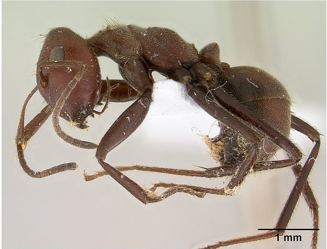
Imagen 4. Colobopsis saundersi explotan cuando realizan un combate con un agresor (Tawatao, 2009).