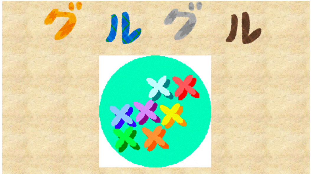
Imagen 3. Guru guru. Onomatopeya usada para decir que algo está rodando o dando vueltas.

Según la definición del Diccionario de la lengua española , una onomatopeya es una “palabra cuya forma fónica imita el sonido de aquello que designa” (Real Academia Española, 2014).