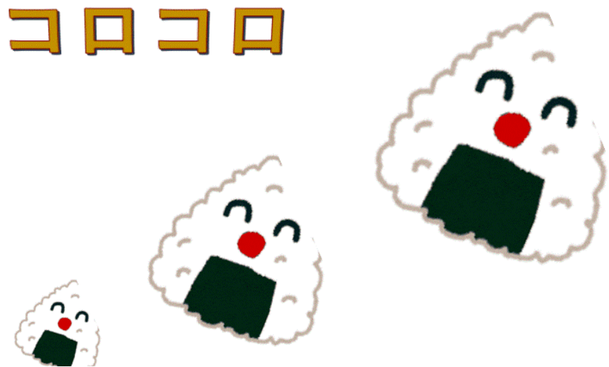
Imagen 1. Korokoro. Onomatopeya al rodar un objeto.

En este proyecto se propone crear material sobre las onomatopeyas, pues es un tema poco abarcado dentro de la enseñanza, que, sin embargo, es esencial en el aprendizaje del japonés.