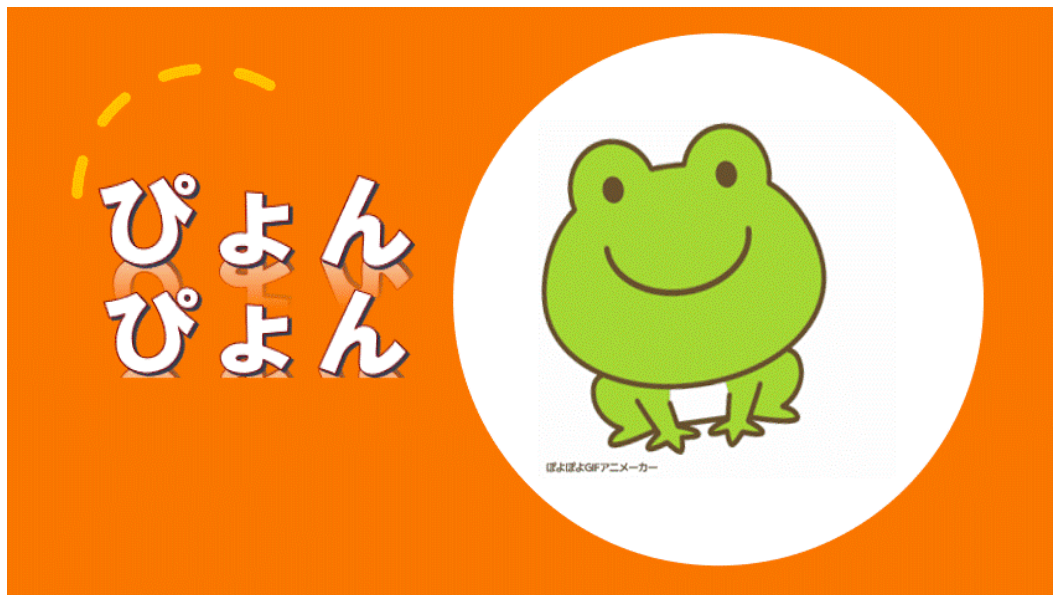
Imagen 4. Pyon pyon. Sonido de cuando se salta.

Las onomatopeyas existen en todas las lenguas; sin embargo, en el japonés existen miles y adquieren otra dimensión pues no sólo imitan los sonidos de animales y de personas, o de la naturaleza y de objetos, sino también los sonidos que hacen al moverse. Además, también representan sentimientos y emociones; condiciones o estados de ánimo.