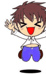
Imagen 5. Uki uki. Onomatopeya de cuando se está muy contento.

Gracias a mi participación en el taller de “Herramientas para la educación docente. De lo oral a lo digital”, pude materializar la idea que tenía en mente acerca de las onomatopeyas en el japonés . Próximamente tomará forma y acción, además de en este artículo, al ser publicado en las redes sociales de la mediateca de la UNAM.