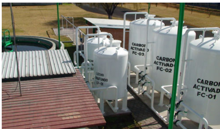
El carbón activado permite la remoción de materia orgánica

El contenido de metales pesados no es significativo, debido a la procedencia del agua residual, que es de actividades domésticas. Asimismo, el contenido de compuestos orgánicos sintéticos no es importante.