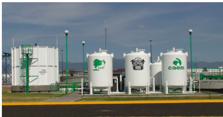
Vista general de la Macroplanta Toluca-Norte

Esta información servirá de base para la definición de los requerimientos técnicos y financieros de un proyecto de recarga masiva del acuífero, ya que de acuerdo a un balance en esta región, la precipitación anual infiltra apenas 76.80 m 3 /s, volumen insuficiente, comparado con la extracción anual, lo que representa alrededor de 85.90 m 3 /s, teniendo un déficit de 9.1 m 3 /s. Para evitar el abatimiento se requiere la recarga masiva de un caudal de alrededor de 1,718 l/s.