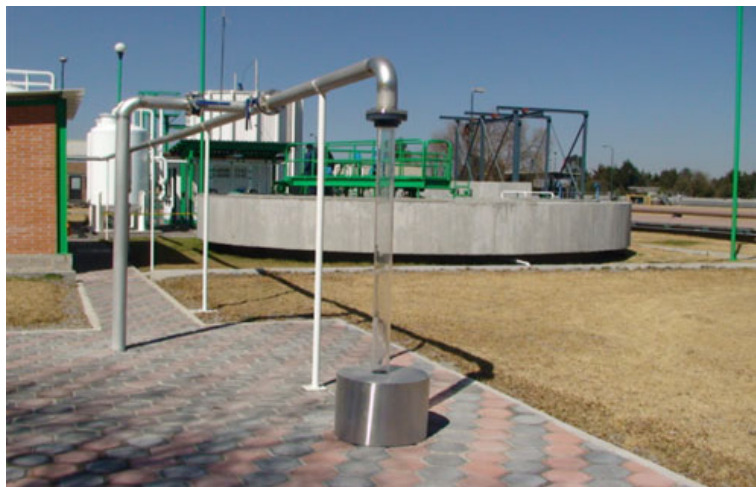
Cada módulo de tratamiento para la recarga masiva será de 50 l

En el mismo estudio se recomendó que en un lapso de 10 años se abatieran los niveles freáticos entre 5 y 6 m, con el fin de evitar pérdidas por evaporación. Lo anterior reduciría las áreas pantanosas y permitiría incorporar esas tierras a la agricultura. Así también se aconsejó iniciar un programa de recarga artificial de la cuenca y los estudios para conocer el funcionamiento del acuífero.