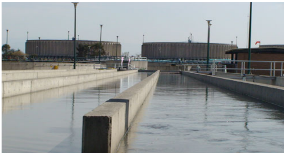
La planta de tratamiento avanzada consta de la remoción de siste parámetros

En la entidad se provee a las poblaciones 40.17 l/s. De éstos el 85% (34.2 m 3 /s) proviene de los acuíferos subterráneos. De igual manera, al Distrito Federal se le transfieren 8 m 3 /s, de la siguiente manera: 2 m 3 /s provienen del acuífero del Valle de Toluca; 2 m 3 /s, del Ixtlahuaca-Atlacomulco, y 4 m 3 /s del acuífero Cuautitlán-Pachuca.