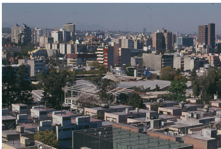
Mancha urbana de la Ciudad de México

ha sufrido tanto por la falta de agua como por inundaciones. Esta situación no sólo persiste en el siglo XXI, sino que se ha agravado, en especial en 2011 con las constantes inundaciones que han tenido implicaciones muy serias para la población. Por ello, sería importante que los gobiernos de las diversas entidades políticas que conforman la Ciudad, trabajaran coordinadamente con la sociedad, con el fin de buscar un nuevo modelo de manejo de agua que permita controlar la sobreexplotación, para evitar la subsidencia del suelo; proteger la calidad de agua de las fuentes de suministro en forma sustentable; emplear fuentes alternas de agua, y controlar las fugas de agua en la red. En lugar de manejar la demanda por medio de tarifas frente a consumos de agua, que son ya muy bajos y que por lo tanto carecen de elasticidad, se debiera hacer mediante el control del crecimiento de la Ciudad.