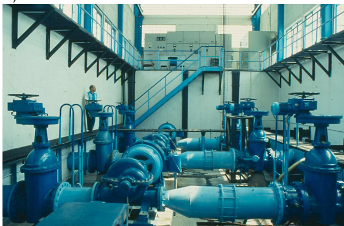
Planta de bombeo de agua potable

El hundimiento de la Ciudad, debido a la sobreexplotación del acuífero, llegó a alcanzar en algunos