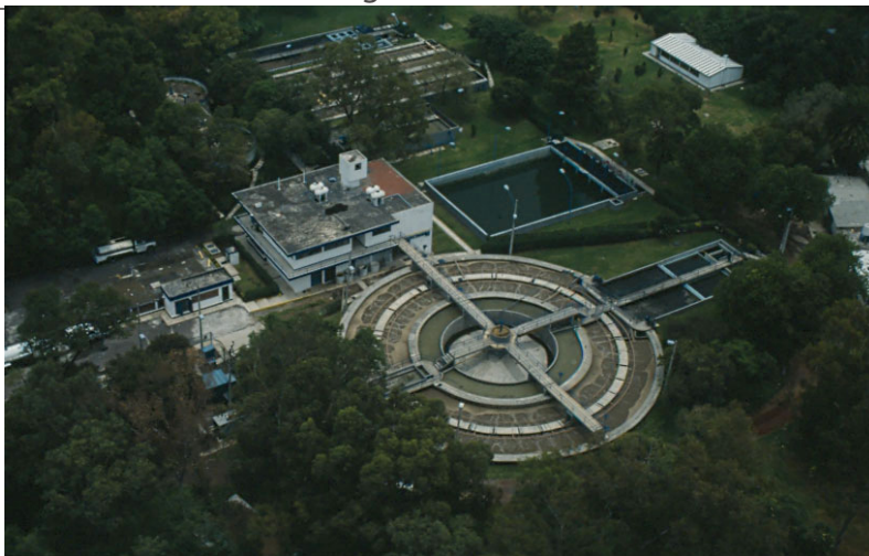
Planta de tratamiento de agua residual de Chapultepec