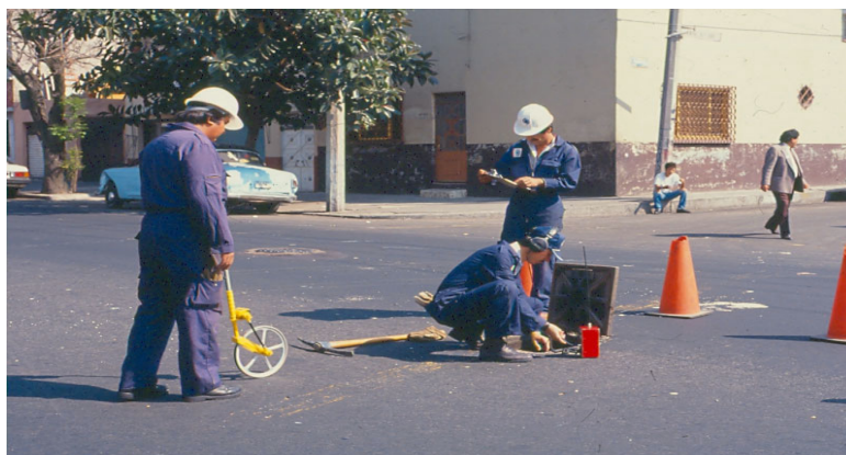
Detección de fugas de agua potable