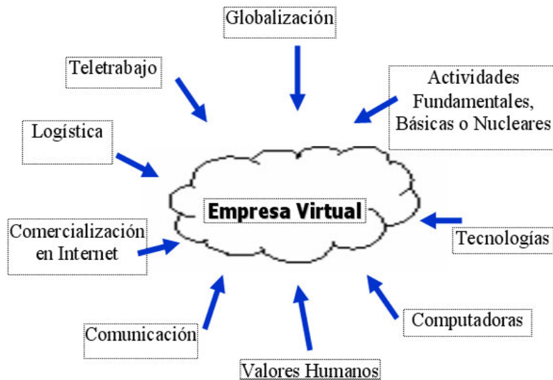
Figura 2.- Descripción de la Empresa Virtual

Si bien es cierto que las empresas tradicionales son realmente distintas entre sí, las empresas virtuales también pueden llegar a ser muy distintas entre ellas, por lo que las características que se citan a continuación deben ser revisadas y ampliadas para cada nuevo diseño de empresa virtual.