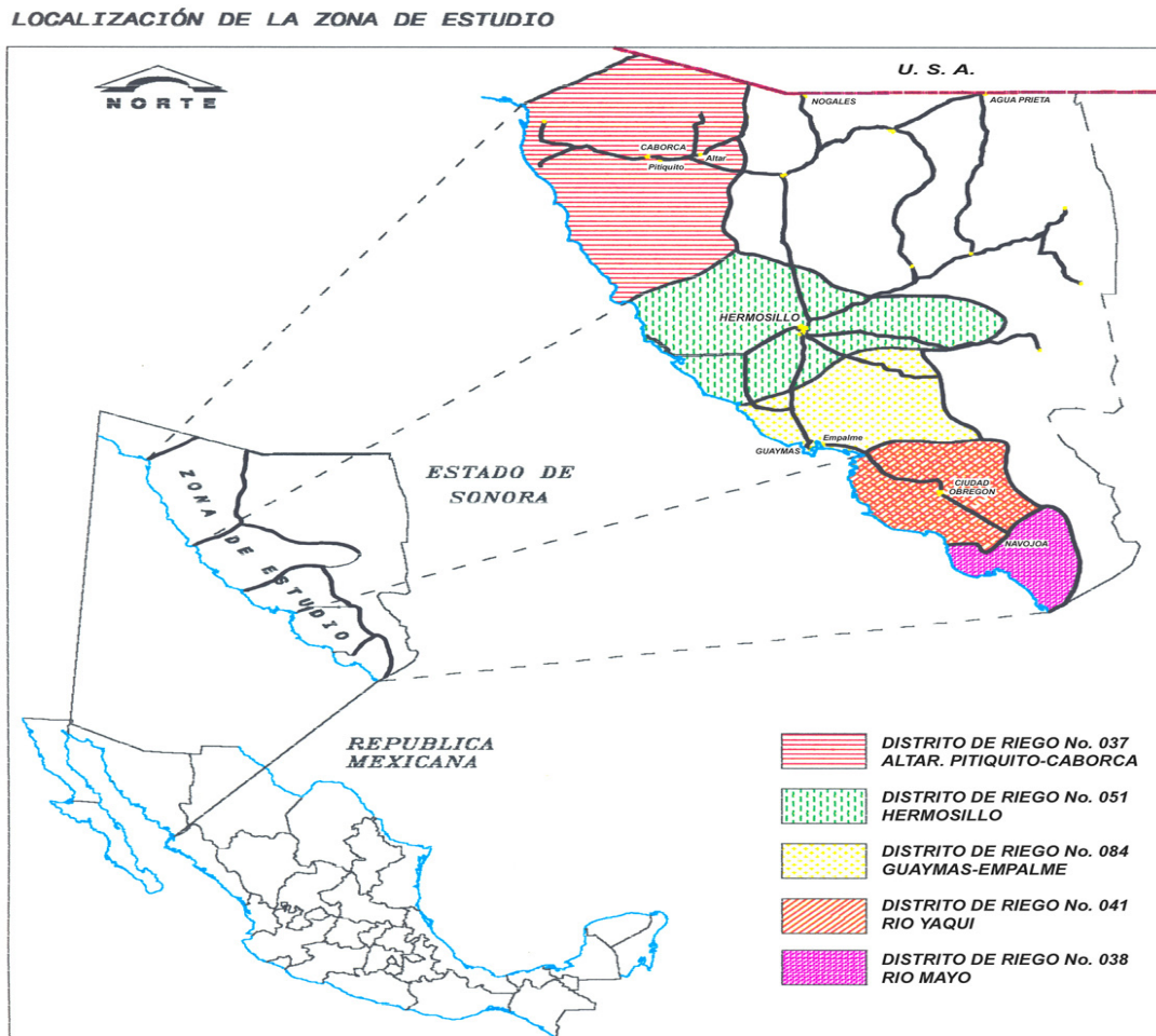
Figura 1.