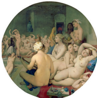
Figura 2. El baño turco (1862), de Dominique Ingres

Pese a la intertextualidad, el poema de Gadhoun no reproduce esta visión orientalista del cuadro de Ingres, aunque sí comparte la exaltación estética de lo sensual. En ambos textos, se estimulan los sentidos: el oído, con las pisadas y sonos que desde el título del poema se evocan en escala de fa mayor, o la mujer que en el primer plano del cuadro tañe una especie de laúd y la que al fondo danza; el olfato con los aromas e inciensos que llenan ambos universos ficcionales; el gusto gracias al sabor de las naranjas y refrescos del poema, o el té y demás bebidas servidas en la jarra de porcelana y taza que forman con la tetera plateada y otros objetos sobre la mesita un bodegón en el primer plano; el tacto, gracias a los roces y texturas de las prendas en ambos mundos; y la visión, mediante las múltiples formas, posturas y actitudes de estas mujeres desnudas.