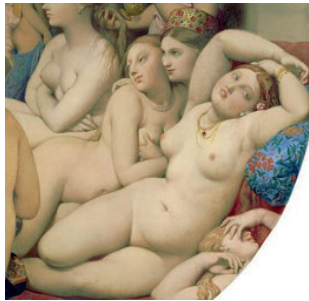
Figura 3. Detalle lésbico de El baño turco (1862), de Dominique Ingres

El baño turco es un lugar público, de gozo puro –natural , heterosexual– y relajamiento; por tanto, las expresiones de afectividad o erotismo no son permitidas. En contraste con esta norma, y por la identidad fluida y los juegos sexuales, se puede considerar a las actantes líricas como destructoras políticas de la heteronormatividad; como también a las dos abrazadas a la derecha del primer plano en el cuadro de Ingres (Figura 3), pues la que parece sultana (según la corona que viste) acaricia el seno y espalda de la otra. Tanto en el harén como en el baño turco serían concebidos como frívolos los actos homoeróticos entre mujeres (Branciforte y Orsi, 2011). Por esta razón, el detalle lésbico en el cuadro de Ingres no debe leerse como una mera objetualización de la homosexualidad femenina en función del placer masculino. En ambos textos, la osadía de las caricias y experiencias lésbicas introduce, en dos contextos modernos / coloniales y falogocentristas, prácticas sexuales no normativas, y cuestiona la estabilidad y control del género femenino.