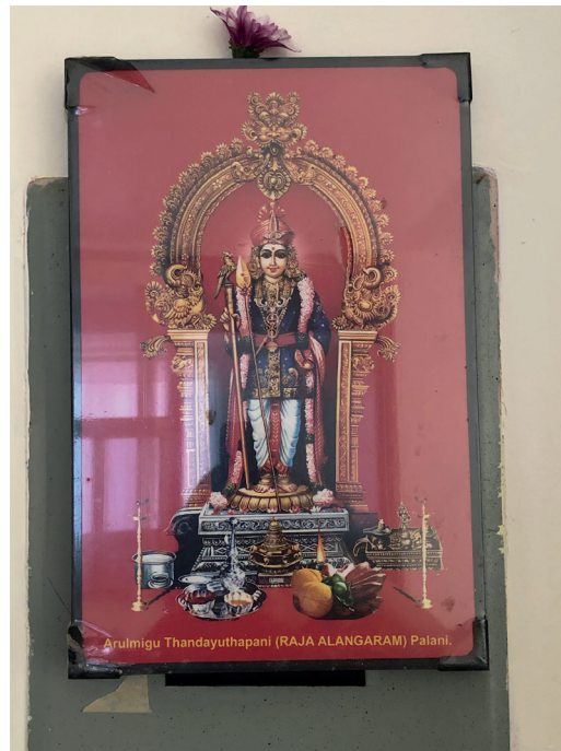
Imagen 7. Dios Skanda en su forma de Alangaram Murungan

Nota: Dios Skanda en su forma de Alangaram Murungan, Señor del Palani, del templo Thandayuthapani, Tamil Naḍu, frente a la caja de carga eléctrica