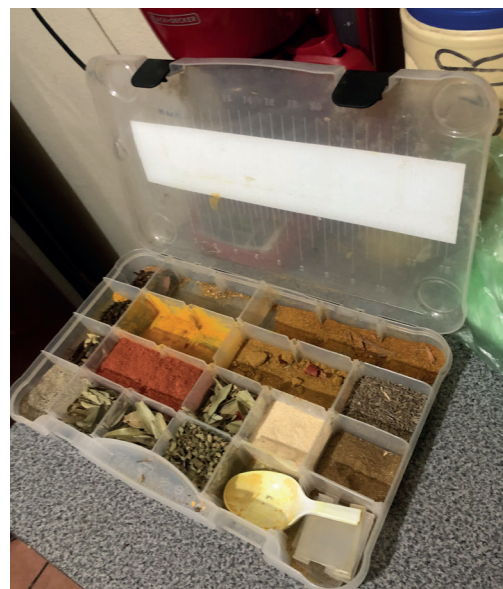
Imagen 3. Caja con especias, casa de Mohnish Rao en Tijuana, diciembre de 2020