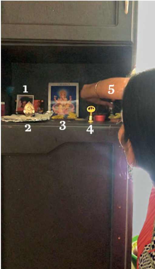
Imagen 6. Altar doméstico de la familia Sharma. Tijuana, 2021

Nota: 1) Sathya Sāi Bābā; 2) portalámpara para āraṭi con la imagen de Gaṇeśa; 3) Gaṇeśa; 4) campana souvenir de Washington D. C., la cual funciona como ghaṇṭa; 5) plato para āraṭi.