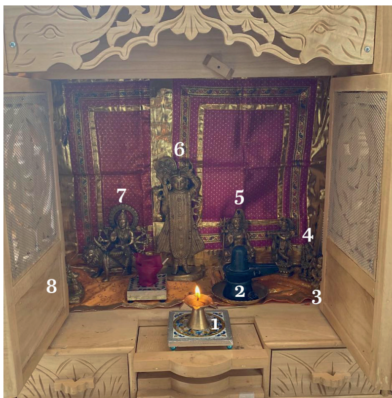
Imagen 5. Altar doméstico de la familia Patterjee. Tijuana, 2021

Nota: 1) dīya ; 2) Śivaliṅga; 3) Hanumān; 4) Kṛṣṇa; 5) Śiva; 6) Śrīnāthjī; 7) Durgā Mātā; 8) mandir de madera