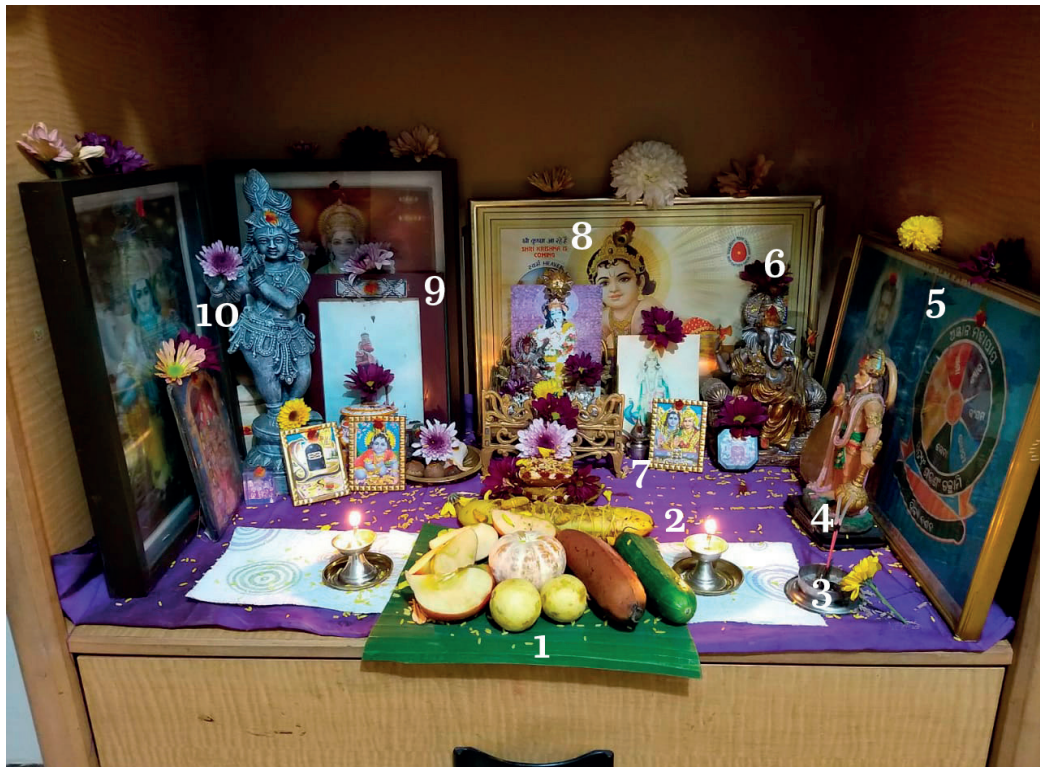
Imagen 1. Altar doméstico de la familia Kubal. Tijuana, 2021

Nota: 1) ofrenda védica; 2) diyas ; 3) incienso; 4) dios Hanumān; 5) guru Sadguru Śrī Śrī Arjunaji; 6) Gaṇeśa; 7) dios Śiva/Śivaliṅga; 8) Bāla Kṛṣṇa; 9) Hanumān del templo de Dattatreya; 10) Gopāla Kṛṣṇa; 11) dulces y flores.