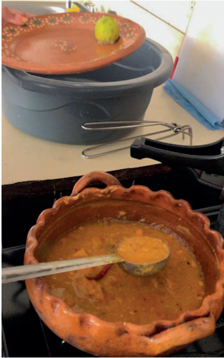
Imagen 8. Sambar en olla de barro mexicana