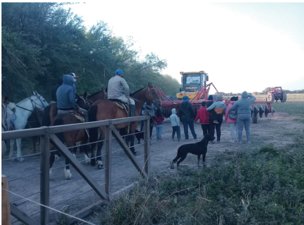
Imagen 1. Movilización en la comunidad La Fermina

Nota: la imagen captura una instancia de organización comunitaria del 6 de noviembre de 2020, en la cual las mujeres y niños/as se ubican en primera fila, a modo de estrategia defensiva, para prevenir posibles enfrentamientos violentos. Se trata en este caso de la comunidad campesina La Fernima, perteneciente al departamento de Añatuya, Santiago del Estero. Según la información provista a la investigadora por parte de miembros de MoCaSE, varios de sus animales habían sido robados y asesinados a modo de amedrentamiento por parte del empresario interesado en dichas tierras. El movimiento de campesinos/as logró posteriormente acordar una indemnización monetaria.