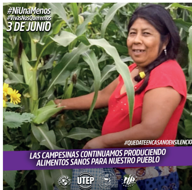
Imagen 3. Adhesión del MNCI a la campaña #NiUnaMenos

Nota: imagen elaborada para la campaña de las mujeres campesino-indígenas en el marco de la manifestación #NiUnaMenos, el 3 de junio de 2020.