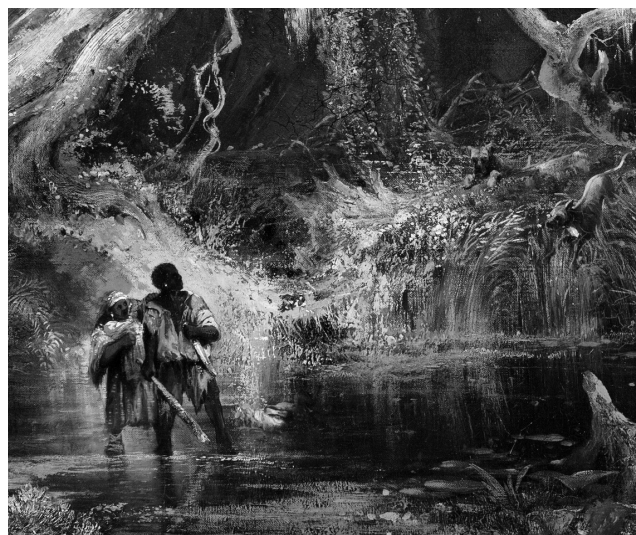
Figura 2. Detalle de Slave Hunt or Slaves Escaping Through the Swamp , Óleo en tela, 85,73 x 111,76 cm. Philbrook Museum of Art, Tulsa, Oklahoma, Estados Unidos.

gilantes, aparentan ser la entrada al pantano), se advierte vagamente la presencia diminuta de dos rancheadores (figura 1). Apenas deslindados, sus sombras también se fusionan con el paisaje, y se requiere un esfuerzo superior de la mirada para detectar su presencia en el cuadro. Miran pero no pueden ser fácilmente vistos. Vienen de lejos siguiendo la pista de sus perros, dispuestos a completar el acto de la cacería.