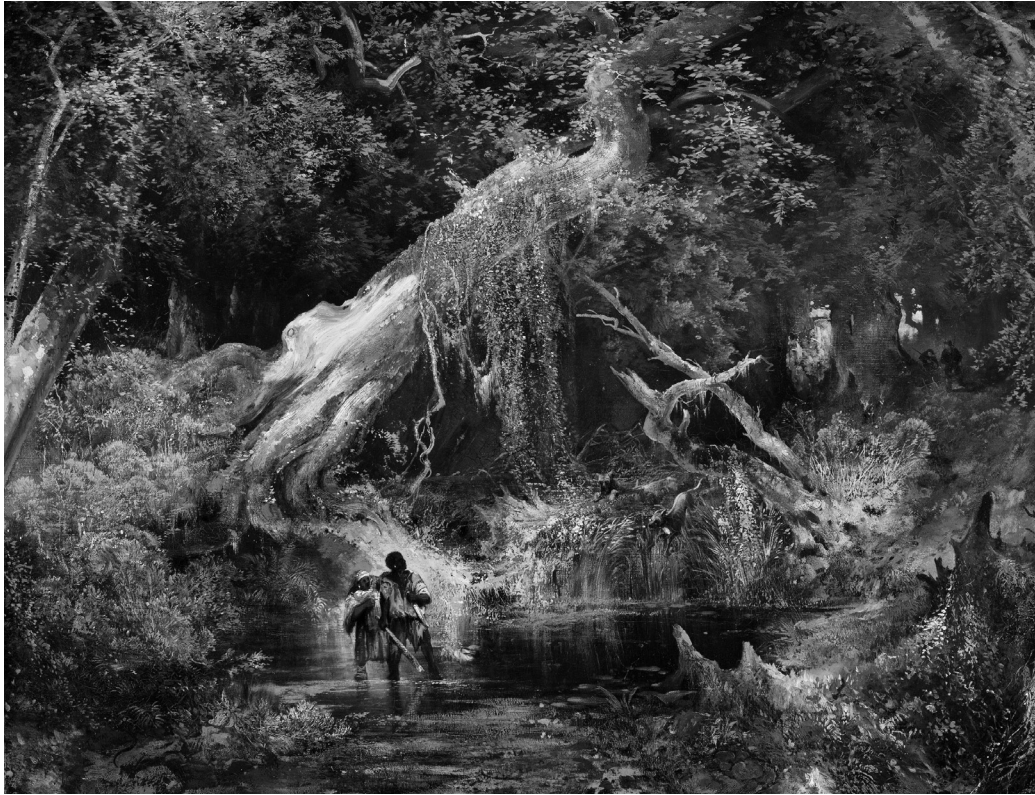
Figura 1. Thomas Moran. 1862. Slave Hunt or Slaves Escaping Through the Swamp [Cacería de esclavos o Esclavos que escapan por el Pantano Lóbrego], Óleo en tela, 85,73 x 111,76 cm. Philbrook Museum of Art, Tulsa, Oklahoma, Estados Unidos.

Nacido en Inglaterra pero criado en Filadelfia, Moran fue parte de la reconocida Hudson River School (Escuela del Río Hudson), el movimiento pictórico que hacia mediados del siglo XIX se dedicó a construir una imagen de la nación norteamericana por medio del paisajismo. Su obra más conocida es la serie de pinturas sobre el parque de Yellowstone, parte del material que motivó al Congreso a declararlo patrimonio y parque nacional en 1872. De corte romántico, los paisajes de Moran participan de la estética de lo sublime, entendida aquí tanto en cuanto a la conceptualización hecha por Burke como en un sentido kantiano: movilizan una retórica visual dirigida, en algunos casos, a sobrecoger por su imponente majestuosidad, produciendo una suspensión de la razón y los sentidos mediante la experiencia del horror. Espacios casi siempre vaciados de presencia humana, la vasta obra de Moran comprende paisajes luminosos y abiertos, llamados a inducir la experiencia temerosa del infinito, pero en no pocas ocasiones se detiene en zonas lúgubres, cerradas y tenebrosas, tales como los pantanos que tan detalladamente ocuparon su imaginación (Anderson 1997; Wilkins 1998).