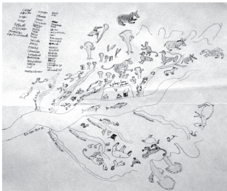
Figura 2. Mapas parlantes dibujados por las comunidades indígenas del resguardo Embera-Katíos de la cuenca alta del río San Jorge, departamento de Córdoba.

especies de anfibios, reptiles, aves y mamíferos. En esta actividad con indígenas adultos se usaron guías de campo para cada grupo taxonómico (Castaño-Mora, 2002; Cuentas et al. , 2002; Defler, 2003; Emmons y Feer, 1997; Hilty y Brown, 2001; Renjifo y Lundberg, 1999; Rodríguez y Hernández, 2002), donde los talleristas revisaron las fichas e identificaron las especies. Se discutieron las apreciaciones de cada grupo de trabajo, percepciones que luego fueron socializadas en carteleras trabajadas por ellos, permitiendo conocer inquietudes y la percepción de cada una de las comunidades sobre la fauna existente para este resguardo. Se hizo énfasis en la información suministrada por cazadores, permitiendo conocer las técnicas de caza, tendencias poblacionales de las distintas especies utilizadas y aspectos generales del estado de conservación de los recursos naturales de la zona.