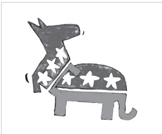
Demócratas vs Republicanos, Chócolo

Chócolo: El humor y su expresión plástica.