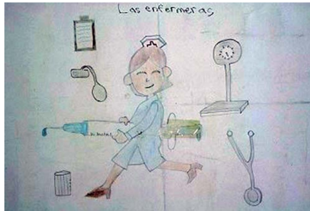
Dibujo 5 "Las enfermeras"