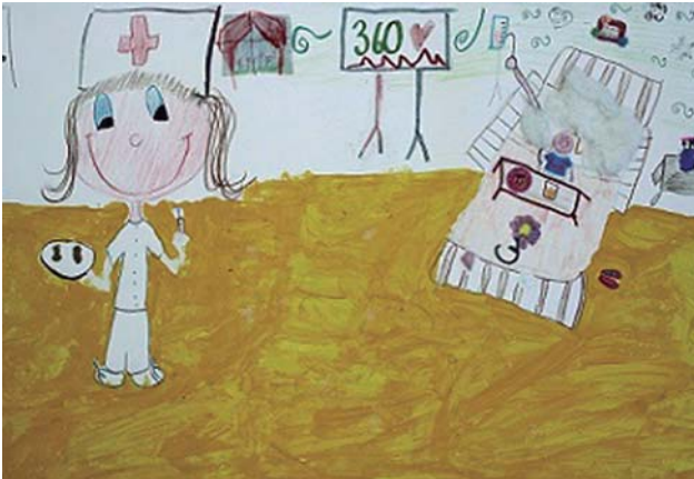
Dibujo 1 Un día en el hospital

Autora: Samantha (10 años) Concurso de Dibujo Infantil con técnica libre "A qué se dedican las enfermeras"