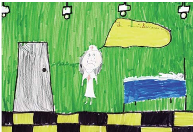
Dibujo 3 "También ayudamos al buen morir"