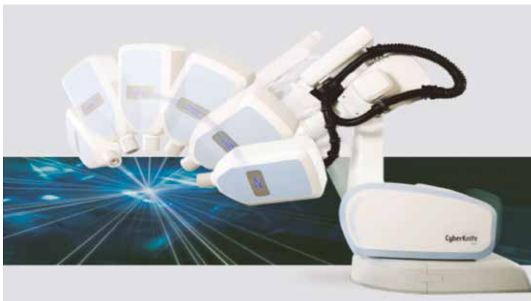
Figura 2. Acelerador lineal CyberKnife (mesa robótica y colimador tipo iris)