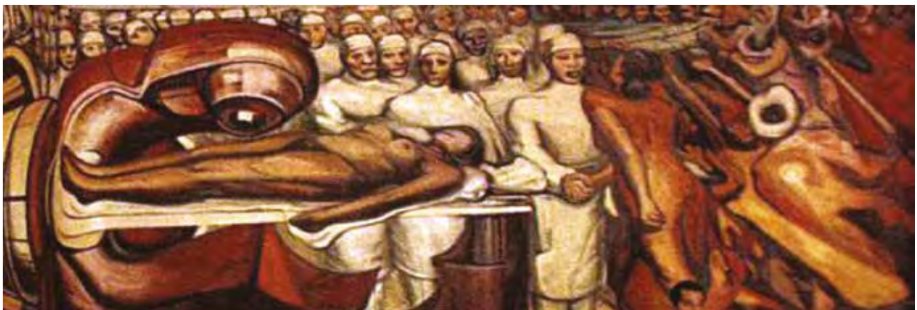
Figura 1. Fragmento de El presente simbolizado por la bomba de cobalto de David Alfaro Siqueiros (1958)

En el tratamiento de braquiterapia se manejaba una