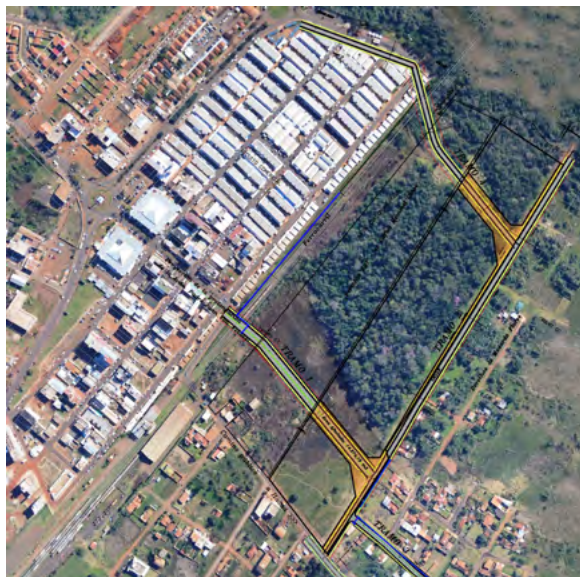
Figura 1. Barrio San Pedro. Fuente: elaboración propia, a partir de Google Maps (s. f.). [Shelburne Farms. Shelburne, VT] [Satellite Map]. Recuperado el 16 de julio de 2018 de: https://goo.gl/maps/vEy1g , 2019. CC BY-NC