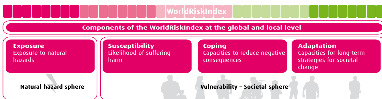
Figura 1. Concepto del World Risk Index