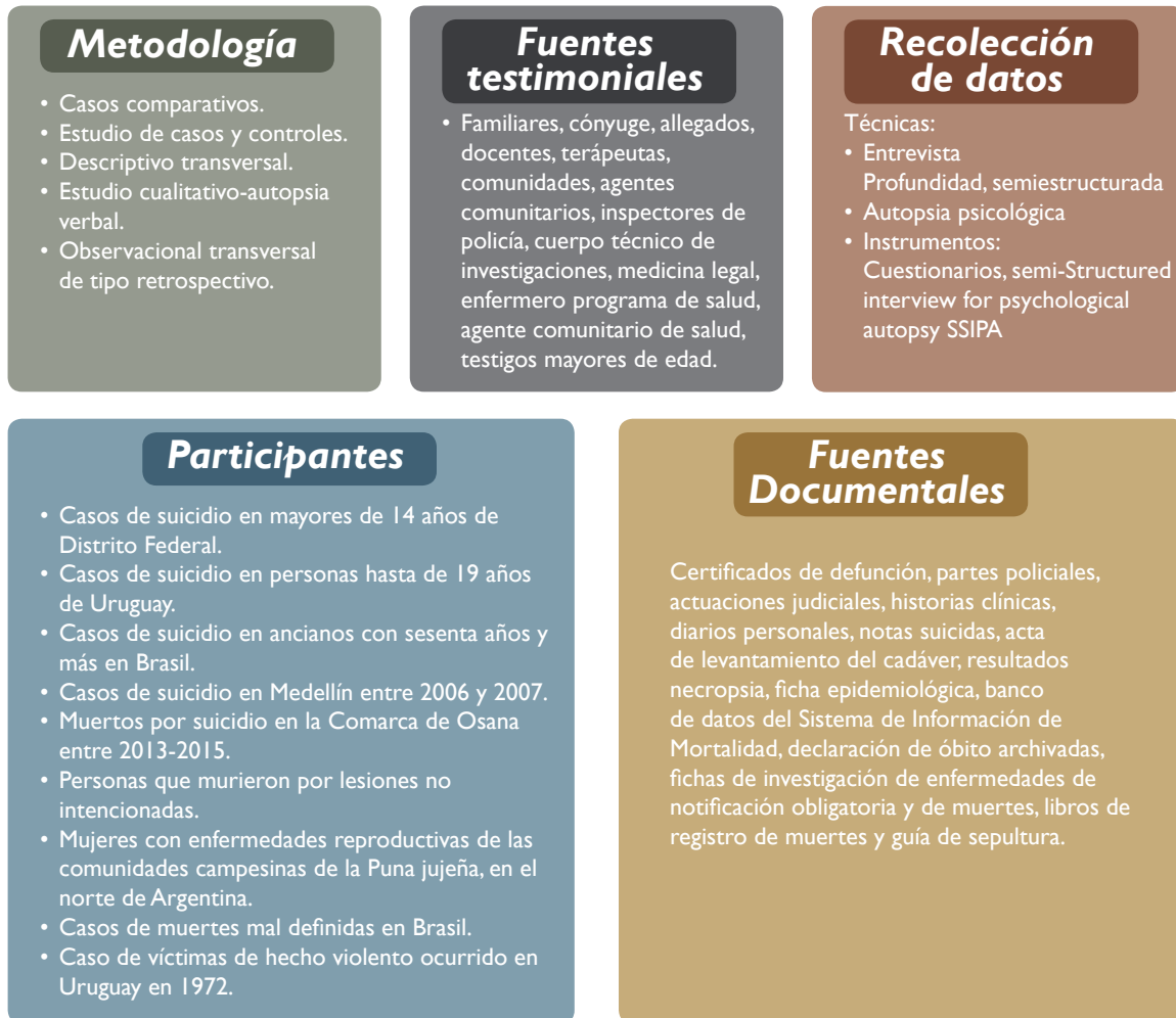
Figura 4. Métodos de estudio de Autopsia Psicológica identificados en la revisión.

La segunda variación, también teniendo presente la denominación y aplicación, es la de la autopsia histórica, la cual plantea una investigación medicolegal de las causas y circunstancias de una muerte, pero con interés histórico.