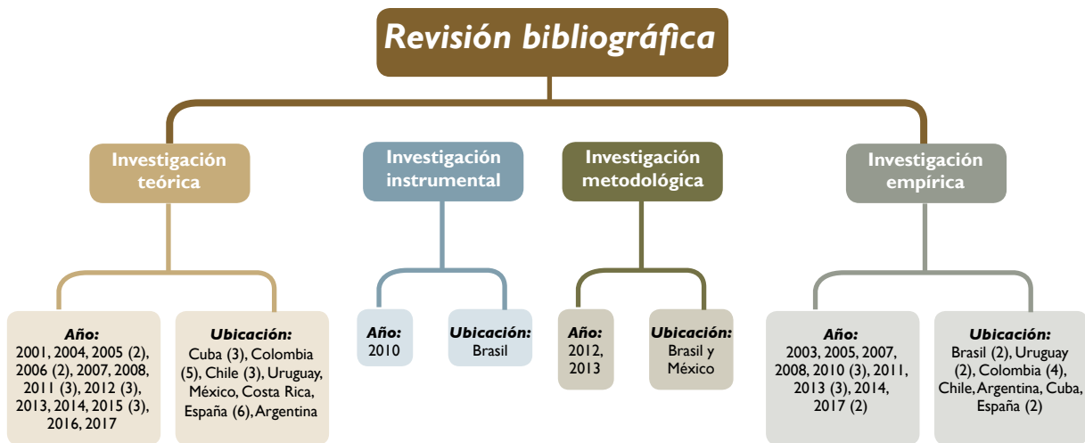
Figura 2. Ubicación, año y diseño de unidades de análisis.