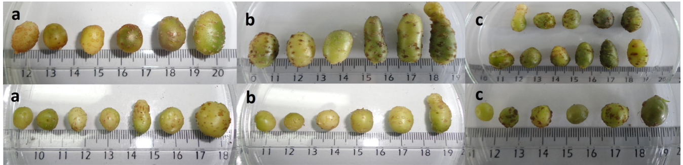
Figura 2. Microtubérculos de G (arriba) y AN (abajo), incubados bajo condiciones fotoperiódicas, cosechados de vitroplantas pre-tratadas con GA y subcultivadas en MS suplementado con BA: a) 0 mg/L, b) 1mg/L, c) 5mg/L.

tarea debido a múltiples factores. Entre ellos destacan el efecto de hormonas vegetales tales como BA y GA (Zhang et al. , 2005; Aksenova et al. , 2011). Las GAs promueven la elongación de los vástagos permitiendo de esta manera la formación de un mayor número de microtubérculos desde la base hasta el ápice de las plantas, mientras que las citoquininas inducen posteriormente la división celular y la formación de los microtubérculos. El fotoperiodo es otro de los factores que promueve la microtuberización en papa, promoviendo la morfogénesis de dichos órganos de almacenamiento cuando las plantas son cultivadas bajo días cortos (Igarza et al. , 2012).