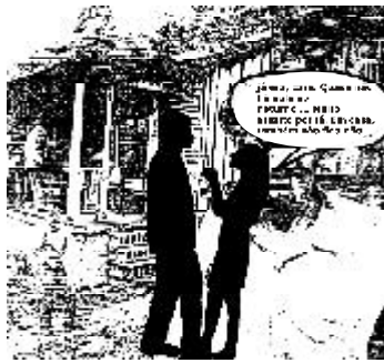
Fig. 2 A qualidade de vida expressa os enlaces e as rupturas entre as diferentes dimensões de mundo.

Projetos dirigidos às bolhas da superfície ocultam graves anomalias no bojo do caldeirão, gerando uma exclusão de princípio : diagnóstico redutor, políticas segmentadas, agravamento da situação. Nessa situação, ao tentar desembaraçar os fios do novelo, mais emaranhada torna-se a meada