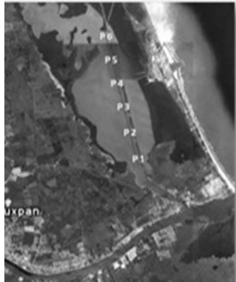
Figura 2. Puntos de Muestreo en la laguna de Tampamachoco.

Se colectaron tres muestras en cada sitio por época climática (nortes, lluvias y secas). Cada muestra consistió de 100 a 120 neritas con tallas de 1.21 \pm 2.5 cm, que fueron limpiadas para eliminar restos adheridos y algas, luego transportadas al laboratorio de la Facultad de Ciencias Biológicas y Agropecuarias de la Universidad Veracruzana, siguiendo los protocolos que establece la NOM-001-ECOL-1996. Con la ayuda de un microscopio estereoscópico y un estuche de disección se procedió a separar el tejido y la concha. Se colocaron las muestras en cápsulas de porcelana y se procedió a calcinar en mufla ( 400^{\circ}\text{C} ) hasta la mineralización total. Los métodos usados en tejido para la digestión vía seca fueron de acuerdo con NOM-001-ECOL-1996 y en concha se utilizó la metodología de Palacios Fest et al. (2003). Una vez realizadas las digestiones, para su posterior análisis cada muestra fue enviada a los laboratorios Mensuranda S.A de C.V. Las concentraciones de cadmio, se determinaron usando la técnica