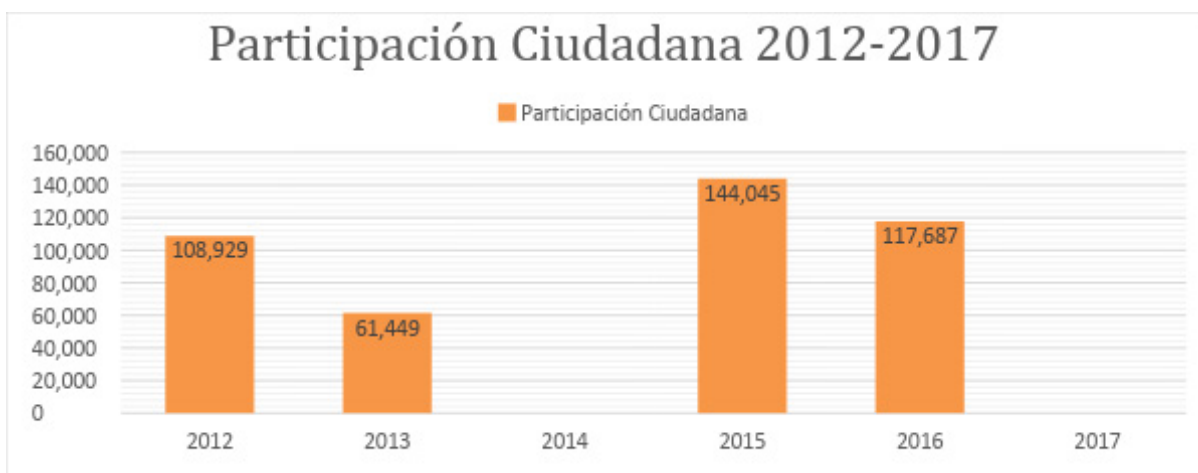
Figura 3. Participación ciudadana en asambleas barriales 2012-2017

Fuente: elaboración propia con datos de la Secretaría de Participación 1 .