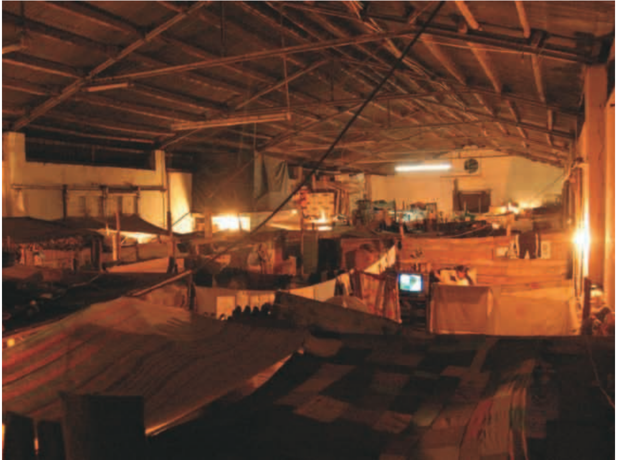
Bodegas Mayo 18/06