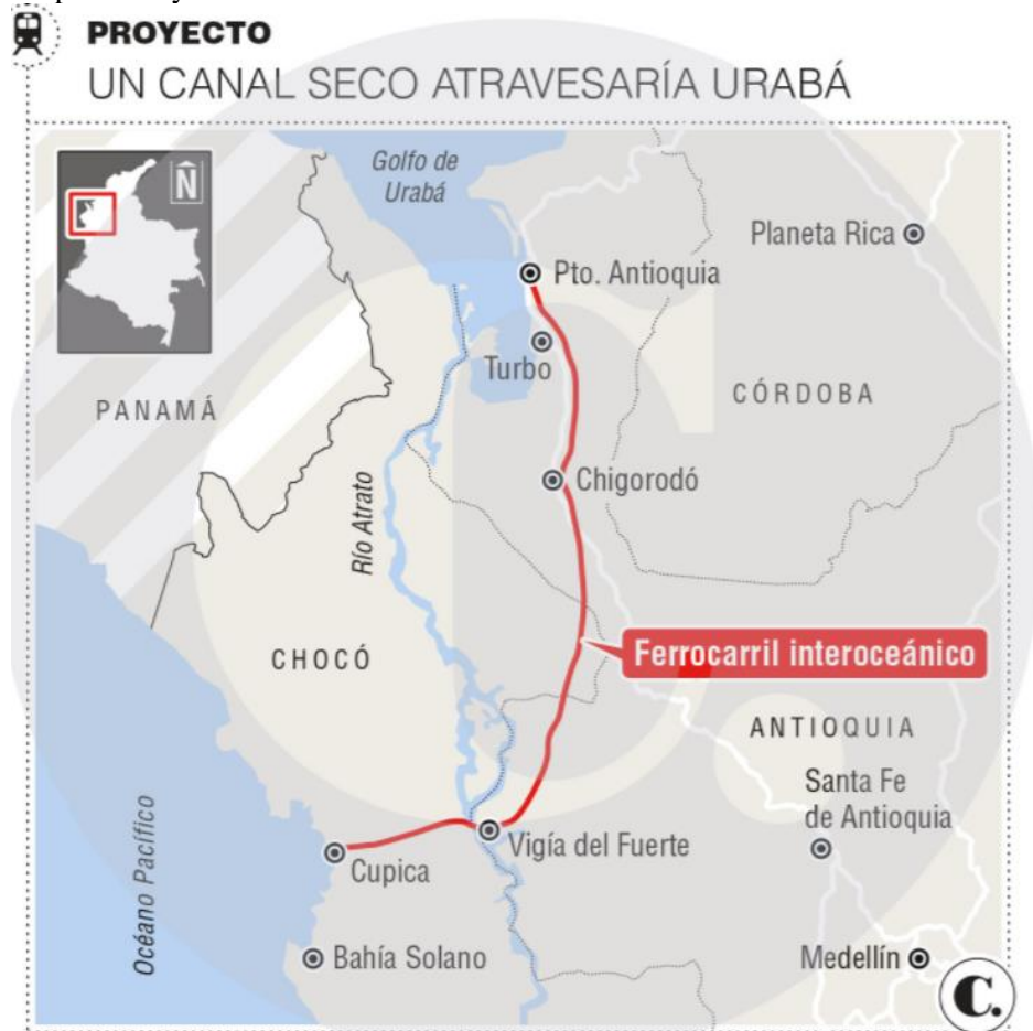
Mapa 5: Proyecto Canal Seco. Urabá.

Fuente: Ingeniero Gonzalo Duque. Infografía: EL COLOMBIANO © 2017. PA (N4)