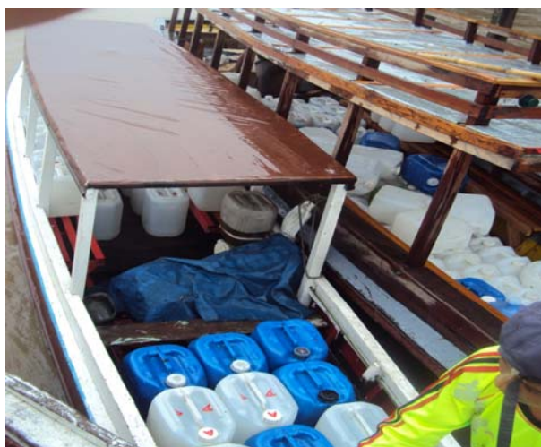
Figura 3 – Barqueiros vendendo água.

A pesquisa “Aproveitamento da água da chuva e desenvolvimento local: o caso das ilhas de Belém” (VELOSO, 2012) apresentou o diagnóstico do abastecimento de água para fins potáveis nas Ilhas Grande e Murutucu. O estudo revelou que 20% dos moradores faz uso da água do rio para beber e/ou cozinhar. Cerca de 45% adquirem (por conta própria ou comprada) água extraída de poços em localidades do município próximo, Acará, ou ainda obtida em pontos localizados na orla de Belém. Cabe salientar que a água comprada, não se refere à água mineral. Os ribeirinhos compram recipientes de 20 litros a R$2,00 de barqueiros que entregam porta a porta (ver Figura 3).