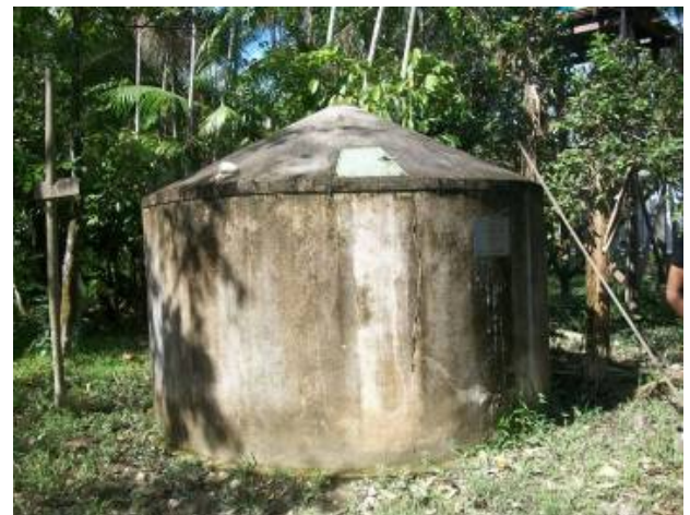
Figura 5 – Cisterna na Ilha Grande.

Segundo dados do INMET, obtidos a partir da série histórica do período 1961 a 1990, da estação pluviométrica número 82191, localizada na cidade de Belém, a precipitação pluviométrica foi 2893,1mm/ano, um bom índice para o aproveitamento da água da chuva.