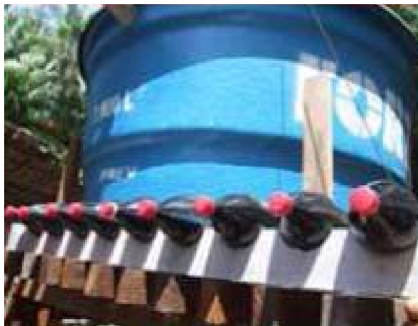
Figura 7 – Aplicação da técnica SODIS.

A Figura 7 mostra detalhes do procedimento.