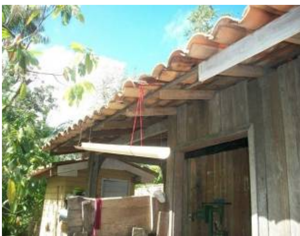
Figura 11 – Sistema de captação da água da chuva improvisado por moradores.

Como forma de sistematizar a produção acadêmica/científica sobre a temática apresenta-se sinteticamente, através do Quadro 2, os estudos desenvolvidos e em andamento sobre a água da chuva, no âmbito espacial das áreas insulares de Belém.