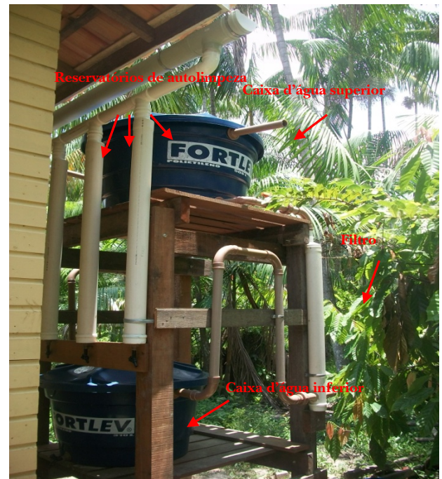
Figura 9 – Sistema-modelo na Ilha Grande.

O projeto, ainda em andamento, é financiado pela Fundação de Amparo a Pesquisa do Estado do Pará – FAPESPA e pelo CNPq e tem atuação nas Ilhas Grande, Murutucu. Em breve sofrerá expansão de suas atividades para as ilhas Combú e Maracujá (OLIVEIRA, 2009). Tal iniciativa estimulou a criação do Grupo de Pesquisa Aproveitamento da Água da Chuva na Amazônia, com pesquisadores da UFPA, IFPA, Secretaria Estadual de Meio Ambiente – SEMA.