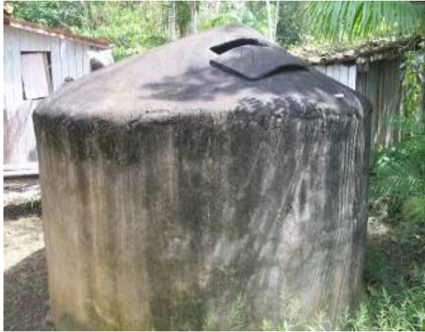
Figura 8 – Cisterna na Ilha Combú, comunidade Periquitaquara.

Tem-se ainda, em 2009, uma iniciativa organizada pela associação de moradores da Ilha do Combú: a instalação de um sistema de captação da água da chuva e distribuição via bomba submersa acoplada dentro do reservatório, localizado na comunidade do Periquitaquara.