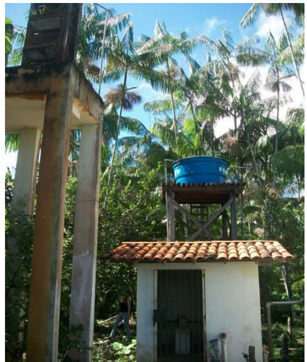
Figura 2 – Sistema de captação subterrâneo Ilha Grande.

A maior limitação dessa fonte de captação é a qualidade da água. Vários estudos já apontaram os altos índices de Ferro nos aquíferos da região de Belém (PICANÇO et al. , (2002); ALMEIDA et al. , (2004); BANDEIRA et al. , (2004); ANA (2007).