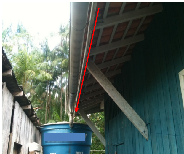
Figura 6 – Sistema de coleta de água de chuva CAMEBE.

Segundo a CAMEBE (2007), a iniciativa visa implantar sistemas de coleta e tratamento de água da chuva para as famílias das ilhas de Belém que vivem com falta de disponibilidade de água potável. O projeto consiste no armazenamento da água da chuva, sem descarte inicial, que se dá através de calhas e tubos instalados nas casas, conforme Figura 6.