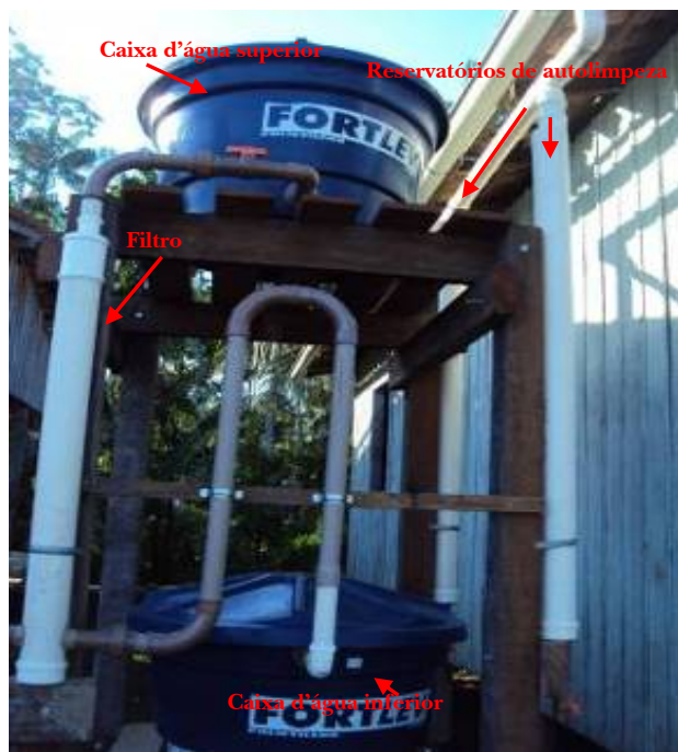
Figura 10 – Sistema-modelo na Ilha Murutucu.

moradores, há dois reservatórios de autolimpeza, um filtro, duas caixas d'água de 310 l, conforme a Figura 10.