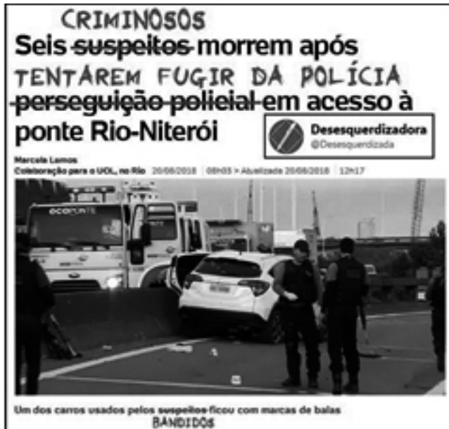
Ilustração 2 - Caneta desesquerdizadora