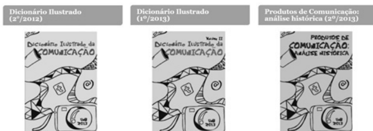
Ilustração 4 – Publicações das turmas de Introdução à Comunicação