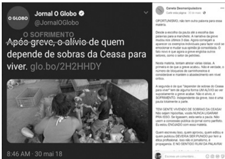
Ilustração1. Caneta Desmanipuladora

para os estudantes buscarem novas referências e perceberem como já consomem e exploram o potencial dessas características do meio digital (e como podem cada vez mais se apropriarem conscientemente dessas práticas). No caso da Marginália e guerra de memórias, o exemplo recorrente apresentado é aquele das fanpages Caneta Desmanipuladora ( www.fb.com/canetadesmanipuladora ) e Caneta Desesquerdizadora ( www.fb.com/desesquerdizada ). O primeiro perfil recolhe notícias divulgadas por portais e questiona algumas palavras utilizadas e a suposta objetividade jornalística. O segundo perfil também reescreve o conteúdo noticioso a partir de uma crítica ao que os administradores da fanpage consideram pensamento de esquerda.