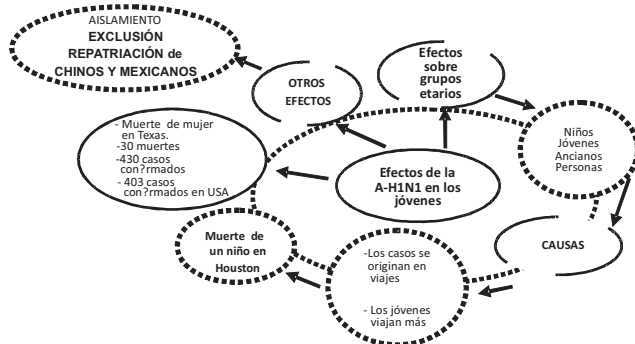
Figura 1. La red léxico –semántica en “GRIPE A-H1N1 afecta más a los jóvenes”